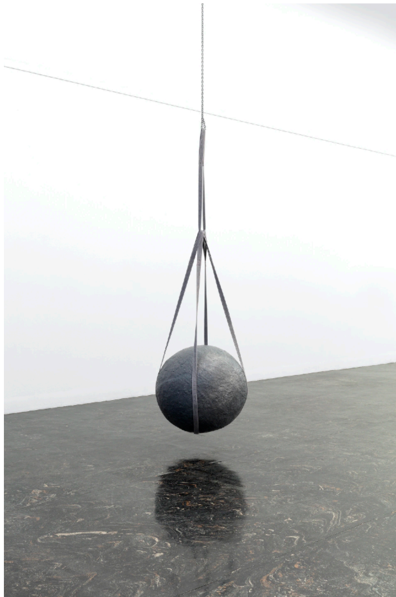
Hanne Tyrmi, Rekyl , 2022

Verket Rekyl har en risk närvarande. Det materiella kan erbjuda en fysisk risk. Det tunga, stora blyklotet skulle kunna sättas i rörelse och attackera både vägg och besökare. Risken som finns i detta verk, är uppnådd mycket på grund av hur det är monterat. Placeringen i rummet, det att det nästan träffar golvet men inte. Remmarna som håller cirkelformen på plats ger känslan av att det kan glida ut och falla ned. Skalan på klotet är hotande för en människokropp. På denna bild ser en inte hur stor kulan är, så jag sätter in en bild till på nästa sida.