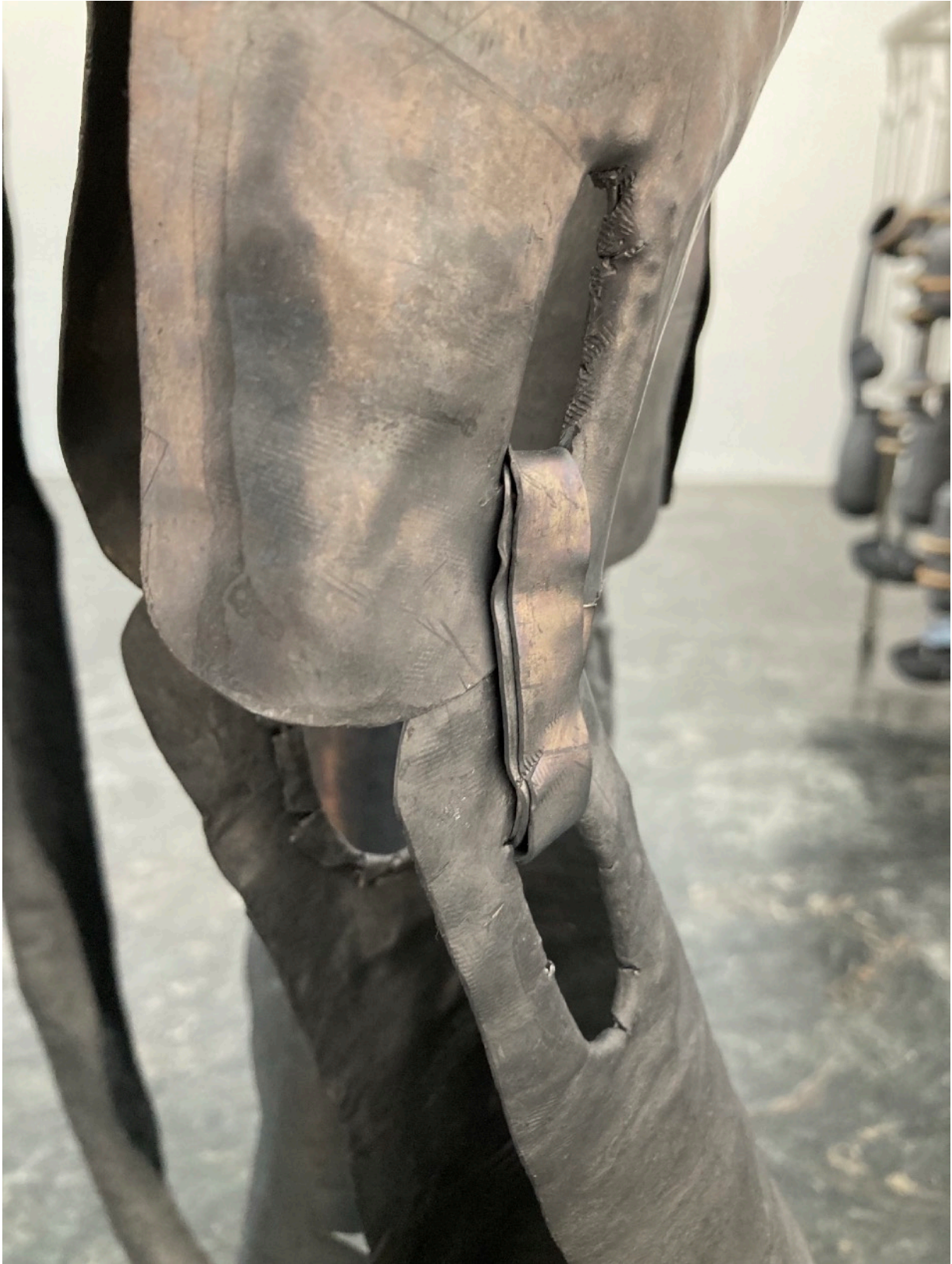
Hanne Tyrmi, Hester dør stående , 2022