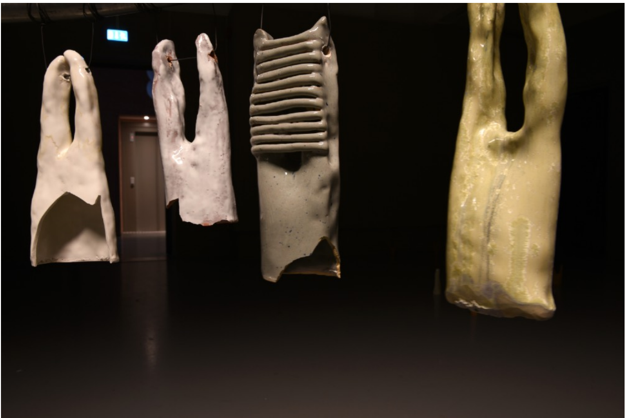
Detaljbild efter konsert