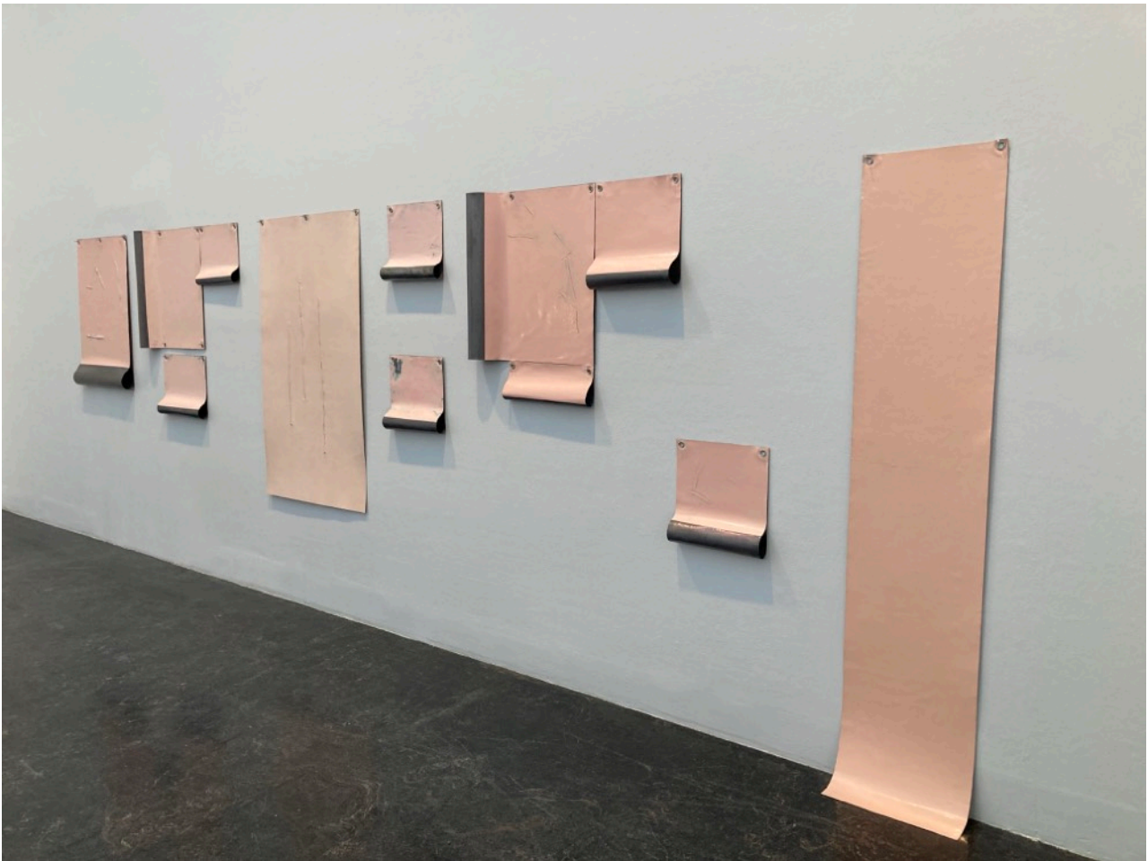
Hanne Tyrmi, Betroelser , 2022

Sättet de hänger bredvid varandra, liksom utrullade på väggen, vittar om att vilja exponera något, att visa alla betroelser på en gång, som att visa sig naken för någon. Ref. till fargebruken av en slags hudton. Jag tycker att Hanne Tyrmi klarar att fånga både sårbarhet och mod hos människan i detta verk.