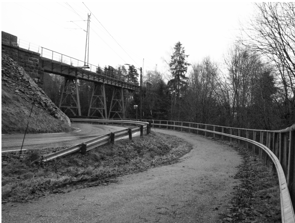
Figur 1. Jernbanebrua, Prestebakke

Tendensen til at mine tanker og kunstneriske prosjek- ter ofte prøver å gjenskape versjoner av fortiden startet kanskje med mitt første møte med døden. Det er akkurat dette stedet hvor det skjedde som dukker opp sammen med stedsnavnet i tankene mine. Ikke nødvendigvis det som skjedde der, men konstruksjonen, landskapet og været på den dagen det skjedde. Ett fragment forteller resten av hjernen hvor dette er.