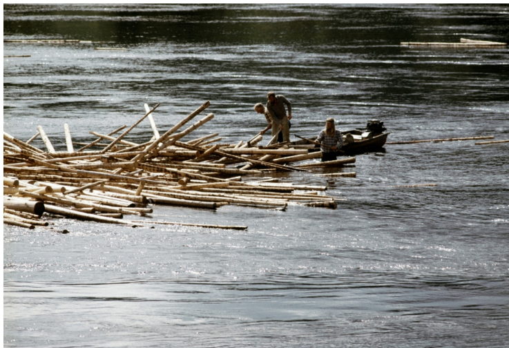
Figur 14. Arbeid i tømmervase, (Rasmussen, 2022, s. 50)

Nilsen etterlot seg en hel del fotografiutstyr han hadde tatt med over Atlanteren. Gamle polerte glass linser omringet av nøye dreiet messing. De eldste er rundt borgerkrigstiden 1860. Men de kommer jeg tilbake til.