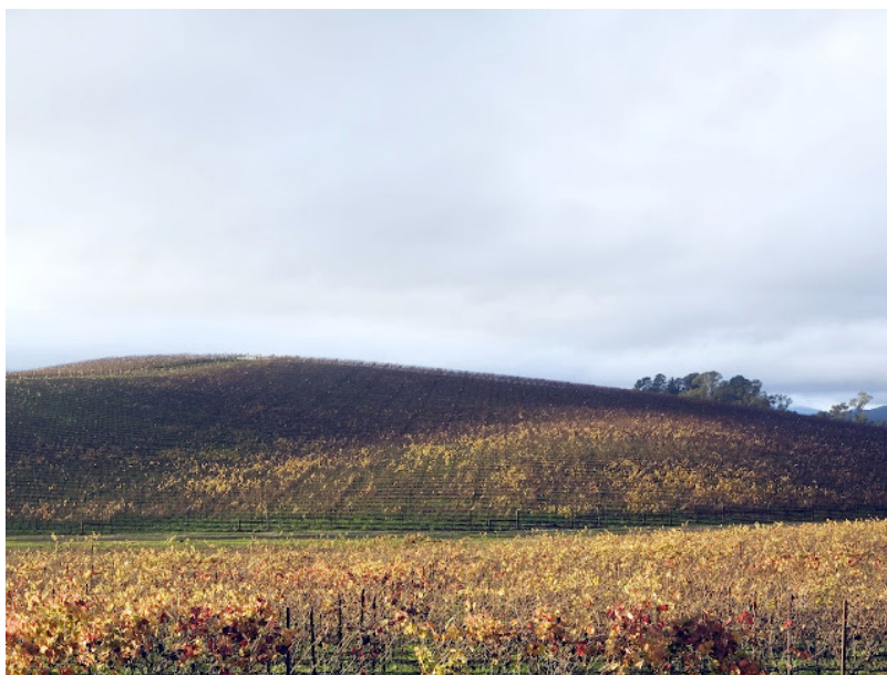
Figur 9. AfterMicrosoft, samme lokasjon som Figur 8, ti år senere (Goldin+Senneby, 2006).

appellerer til mennesker over hele verden. Den frodige åskammen som delvis gløder opp av sollyset som sniker seg mellom skyene. Over og bak åskammen er det en knallblå himmel med skyer spredt pent og pyntelig utover. I forgrunnen langs bunnen ser vi en mørk strek som er med på å dele bildet i tre. Og langs den er det små gule blomster. Jeg ser håp og muligheter i bildet, et blankt lerret. Et operativsystem er også akkurat det, en ramme for det virkelige arbeidet. Men hvor er bildet tatt? Akkurat som landet langt borte eller vestenfor sol og østenfor måne, er dette blitt et sted alle kjenner igjen, men ingen vet hvor er.