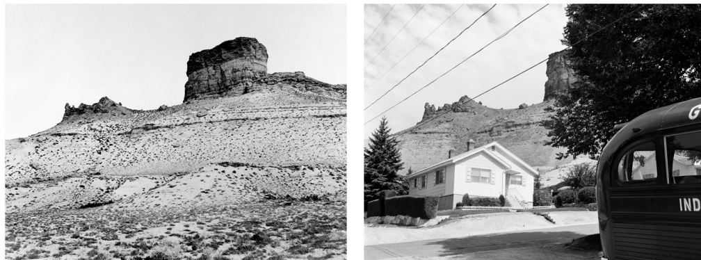
Figur 10. Second View: The Rephotographic Survey Project (Klett, 1979).

Boka Second View: The Rephotographic Survey Project er et eksempel på denne type fotografi. Fra 1977 til 1979 så gjenskapte en gruppe kunstnere ledet av Mark Klett, Ellen Manchester og JoAnn Verburg 122 fotografier fra sent 1800-tall for United States Geological Survey. Oppgaven til de originale fotografiene var å fange karakteristikkene til landskapet vest i USA.