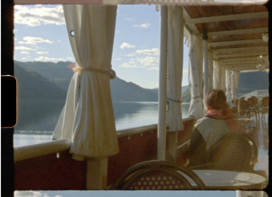
Figur 7. Ombord MS Henrik Ibsen på Bandak i Telemarkskanalen.