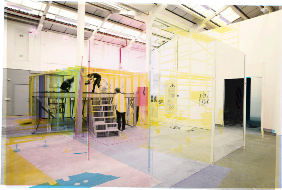
Figur 11. Dette bildet viser en forandring av sted over tid hvor fargeseperasjonene representerer ett øyeblikk på tidslinjen og til sammen lager et nytt bilde ikke ulikt hvordan man selv kan rekonstruere et minne av et sted eller konstruere en alternativ virkelighet.

Designeren James Langdon (2020) forklarer at, “The image is a composite made by combining one colour separation—cyan, magenta, yellow, black—from four different photographs. The photographs were taken by Stuart Whipps from a fixed position—a camera permanently mounted on a bracket on the wall at Eastside Projects, an exhibition space in Birmingham—over the course of two months of the exhibition Narrative Show (C:15 May 2011, M:23 May 2011, Y:10 June 2011, K:15 July 2011)”