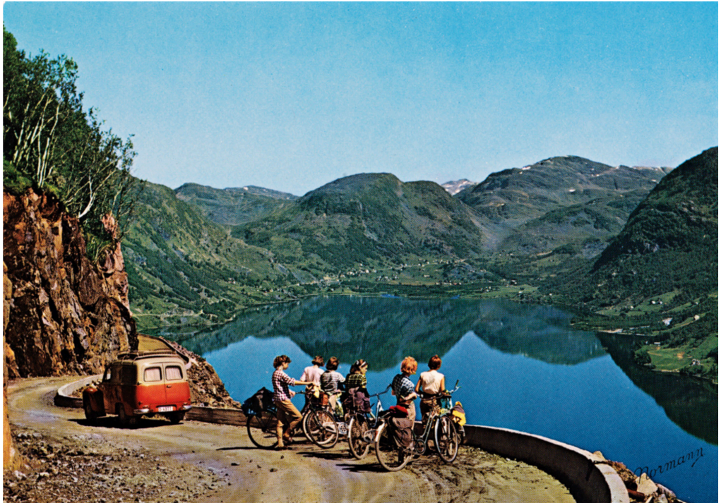
Figur 6. Postkort fra veien Røldal — Sædal, tatt ca. 1965.