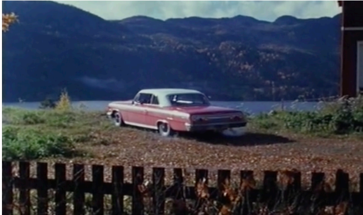
Figur 7. En av sluttscenen i filmen Halvveis til Haugesund (Lund, 1997)

Dette er en scene fra filmen Halvveis til Haugesund, registrert av Lund. Hovedkarakteren Otto har reist fra Oslo og er på vei til Haugesund men blir sittende fast i Telemark i et virvar av småveier og blindveier. Landskapet tvinger veien i alle mulige retninger, men aldri i den retningen Otto skal. Han spør om hjelp, men blir ledet i en ny runddans gang på gang. Telemark er blitt et sted man kommer inn men aldri ut. Fortellerstemmen i filmen forklarer at “Det er ikke nødvendigvis meninga at veiene skal føre ut av Telemark. Sannsynligvis fører de ikke noe sted” Mulig er det slik at jeg heller ikke skal ut av Østfold, ihvertfall mentalt, siden alle mine veier ser ut til å lede tilbake dit. “Hele poenget med en labyrint er at man skal kjøre seg vill, det er ikke noe unormalt med det. Alle blir litt bortkomne her. Det er slik vi vil ha det. Vi trives med det. Før eller seinere havner alle opp i Lårdal”, sier stemmen. Veien slutter nemlig her. Herifra må man ta kanalene og innsjøene fatt.