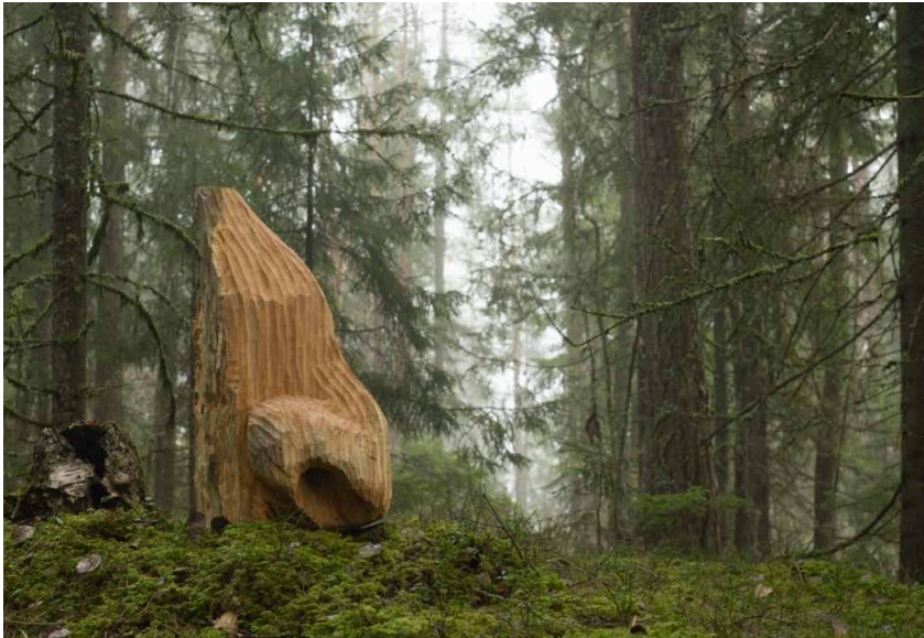
Figur 12. Bestefars nese. Treskulptur plassert i skogen ved småbruket Langnestangen (eget bilde og arbeid)

Hver gang vi kom kjørende til bestemor og bestefar på småbruket, Langnestangen, så sto bestefar alltid klar ved innkjørselen, rett etter andedammen skiltet, og holdt håndflaten sin opp på neseryggen, mellom øynene. Akkurat sånn man gjør hvis man skal blokkere et angrep av noen som vil stikke ut øynene dine med en v-formet hånd. Det var som om vi hadde kommet til et sted hvor ting gjøres litt annerledes. Småbruket ligger på en halvøy og det er kun én grusvei inn. Bestefar sto der som en vokter ved portalen til et rike langt langt borte. Endelig var vi fremme og hilset skulle vi være. Var vi endelig kommet frem til et sted langt langt der borte?