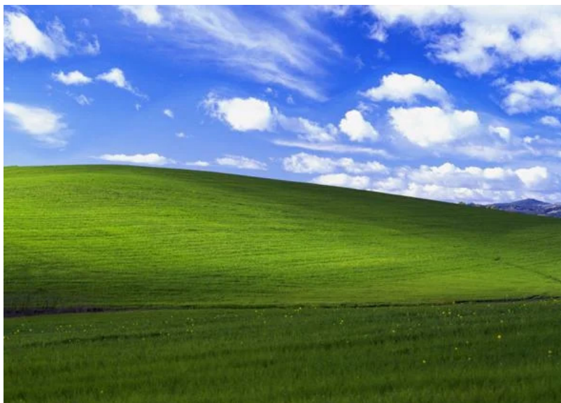
Figur 8. Bliss (originaltittel, Bucolic Green Hills), bakgrunnsbilde Windows XP (O'Rear, 1996)

sammen scener uten å måtte sitte og klippe det hele sammen. Brått så åpnet det seg et helt nytt landskap. Nå kunne den naive reisefilmen bli til en sammensetning av minner. En konstruert virkelighet. Var det fortsatt et sted jeg hadde besøkt? Et sted du eller jeg ville kjent igjen?