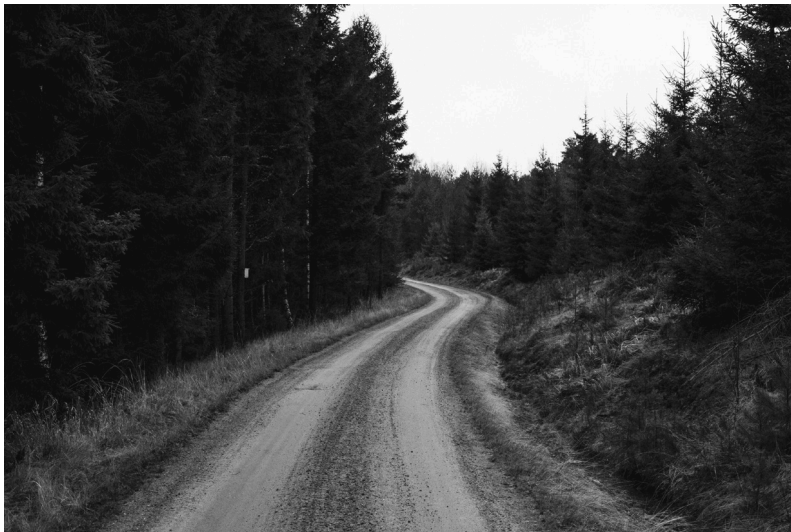
Figur 2. Grusvei langs Løvåsen, Prestebakke (eget bilde)

Prestebakke er et sted. Et sted nærme svenskegrensa, men et stykke unna bygrensa til Halden. Det er et sted med omkring 150 innbyggere. Det har en egen barneskole, en nedlagt togbanestasjon og en kirke. Rett ved skolen bor det faktisk også en liten kalkunfamilie med en veldig aggressiv hannkalkun. Det gjorde det ikke før. Prestebakke er stedet jeg vokste opp.