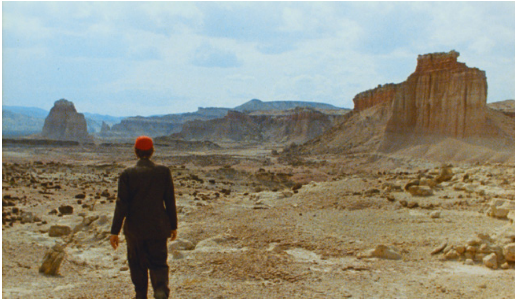
Figur 3. Åpningsscenen i filmen Paris, Texas (Wenders, 1984)

enn langt, fremme på stedet vestenfor sol og østenfor måne. Steder de fleste har hørt om, men som ingen vet hvor er. Dette er minner vi har om steder som aldri har eksistert, eller som vi ikke vet om faktisk finnes.