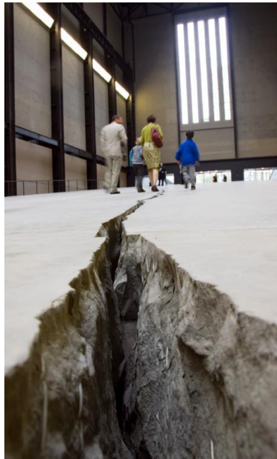
Shibboleth , installation, L167m, Doris Salcedo, 2007