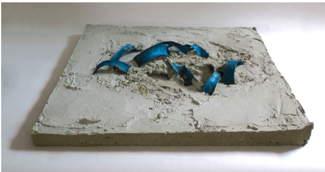
The Old Town Labyrinth , betong og kobber, 50x47x4cm, 2022

Kobberet kaldsmis. Jeg hamrer, og metallet utvider seg. Veiene formes i korpusteknikken. Sementen blandes med vann, grus og steiner. Kobberet senker jeg forsiktig ned i betongmassen. I jorda. Der forsvinner gatene. Drømmen overtar reisen. Virkeligheten slipper fri. Kobberet har patinert, akkurat samme som mange av minnene mine. Steinene faller av, og etterlater hull. Gropete asfalt rundt i byen.