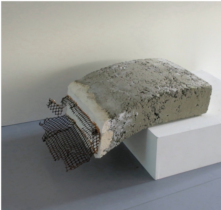
I See Reflections in the Water , betong, gips og stål, 42x30x10cm, 2022

Kontrasten mellom hvitt og gråtoner avspeiler seg tydelig i vanddammen, og jeg tilsetter gips hvor jeg graver metallet inn. Etter at gipsen er stivnet, nyter jeg åpning av denne avvisende metallkonstruksjonen jeg hadde modellert i forkant. Det er befriende.