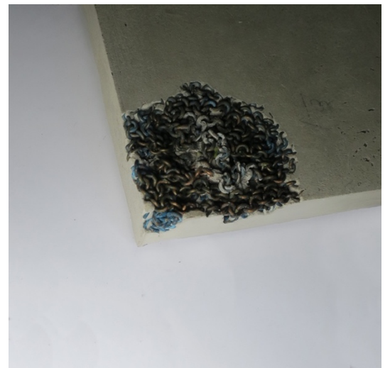
I didn't Go Back , betong og kobber, 31x50x4cm, 2022