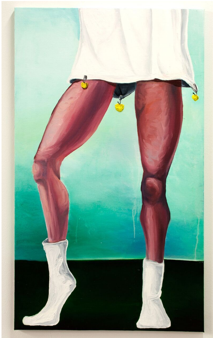
Hjemme Alene fra serien My 90's Are Better Than Your 00's , 2017, Stine Bø.