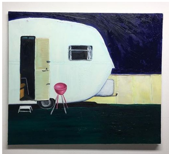
@:-)-/--<, olje på lerret, Stine Bø, 2018.

Såpeopera består av romanser, hemmelige forhold, utenomekteskapelige affærer og ekte kjærlighet. Ved flere anledninger kom det noen lyder fra campingvogna til vår nabo fra Bø i Telemark som hun ikke burde lage da hennes mann var på arbeid i Nordsjøen. Da hun senere kom å satt seg ned hos oss i forteltet de dagene, syntes jeg det var rart hvordan hun trodde ingen hadde hørt henne gjennom de tynne veggene. Hun ble en slags venn av familien etterhvert og det ble mange sene kvelder med hun, og noen ganger hennes mann, eller hennes andre menn.