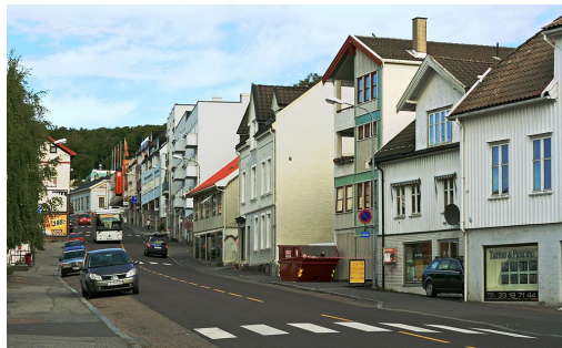
Larvik sentrum 2008.

Min søster har alltid tegnet og jeg har samlet og brukt små objekter til og lage installasjoner av det. Hun som nå er illustratør så ikke samme verdi i en stein, serviett og colakorksamling som meg og ga de vekk til nabobarna. Vi har alltid vært uenig i hvordan man bør leve som en kunstner, men jeg ser vi tok de små tingene miljøet vi levde i ga oss og gjorde det om til noe inspirerende.