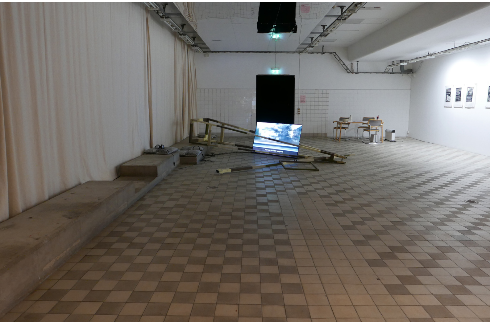
Installation view in Konsthall C - Nordic Troubles 2018

The film's title Sicherheit refers to research by the sociologist Zygmunt Bauman on the term Sicherheit where he concludes that all security solutions are built on an economy of fear. In the work with the film connections are drawn between questions of security, migration and weapon export in order to approach a self-image of a country like Sweden from an individual's point of view.