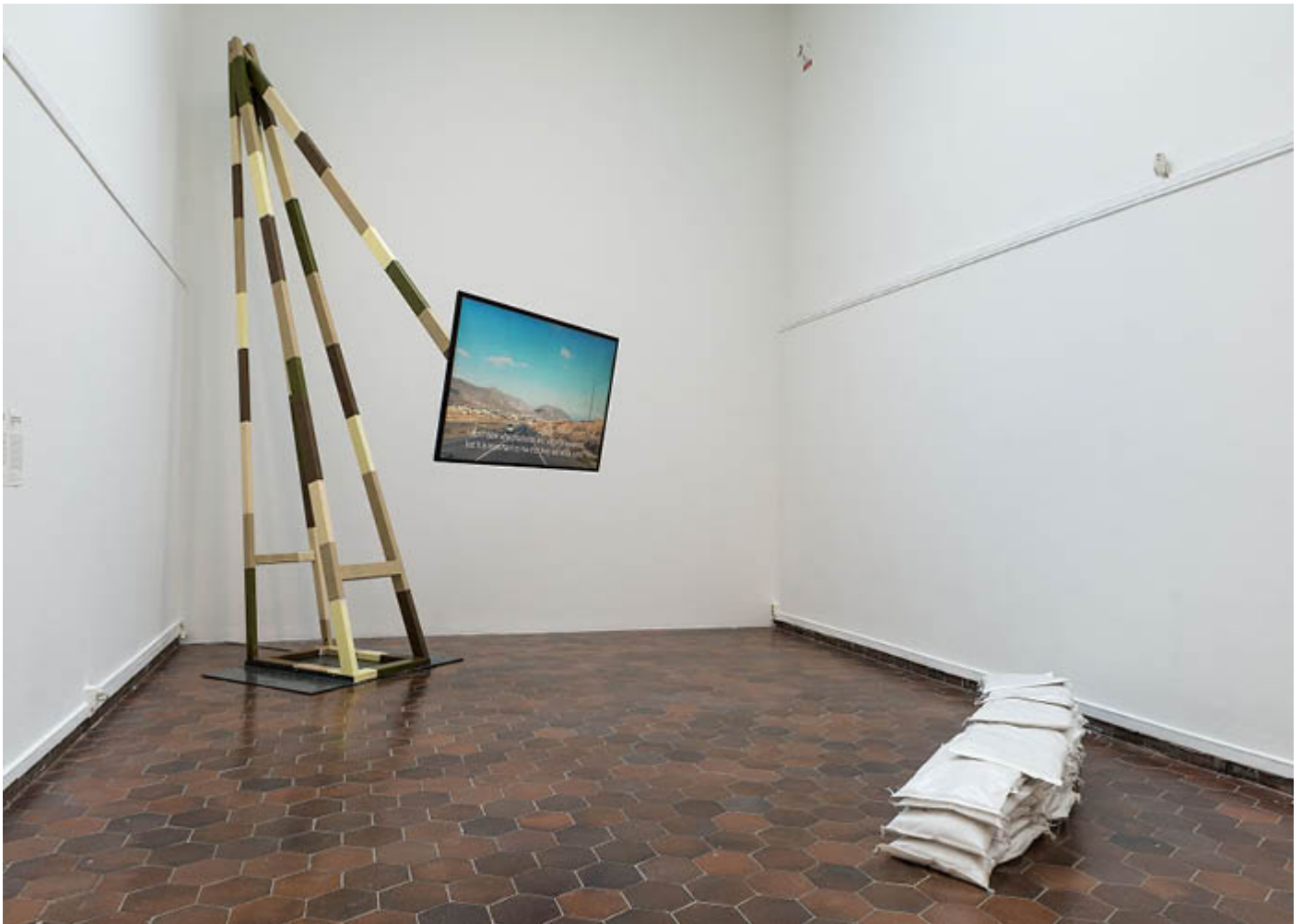
Installation view during GIBCA - On the Secular 2017

Vimeolink: https://vimeo.com/233565095 password: security