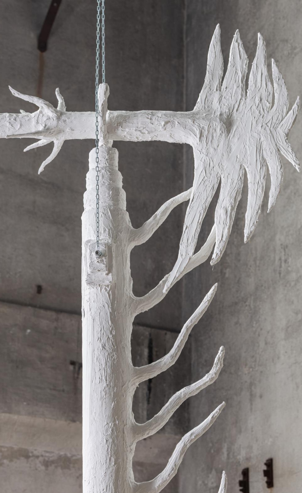
Access, skulpturur, 2023, 270 x 320 cm