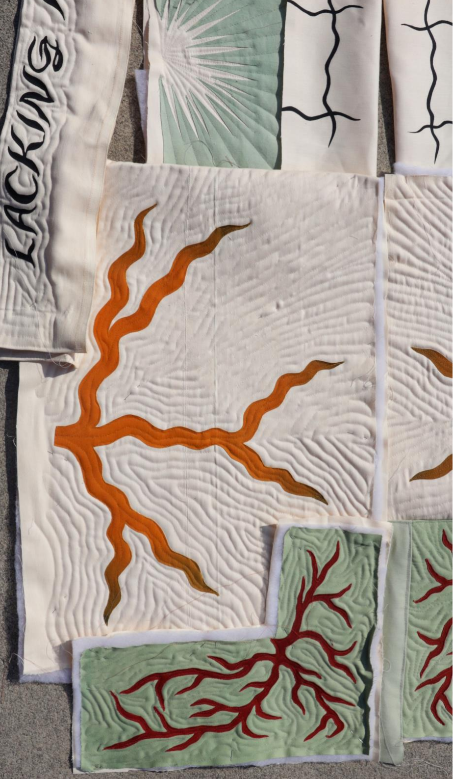
Venusbunad III, A New Skin for an Old Ceremony, (verket er fortsatt under produktion) 2024