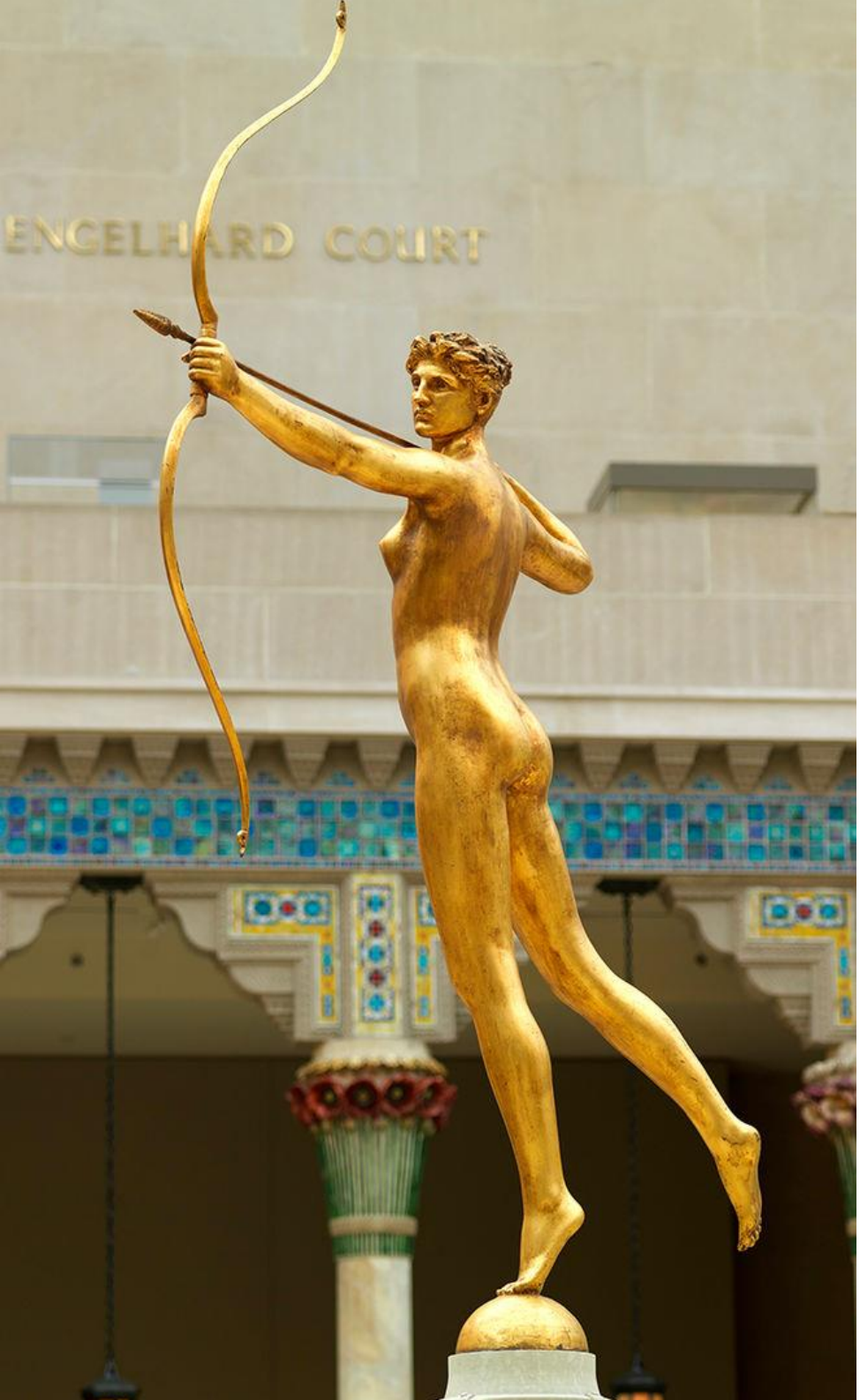
Statue av Artemis ( Romersk: Diana ), The Metropolitan Museum of Art, 1894