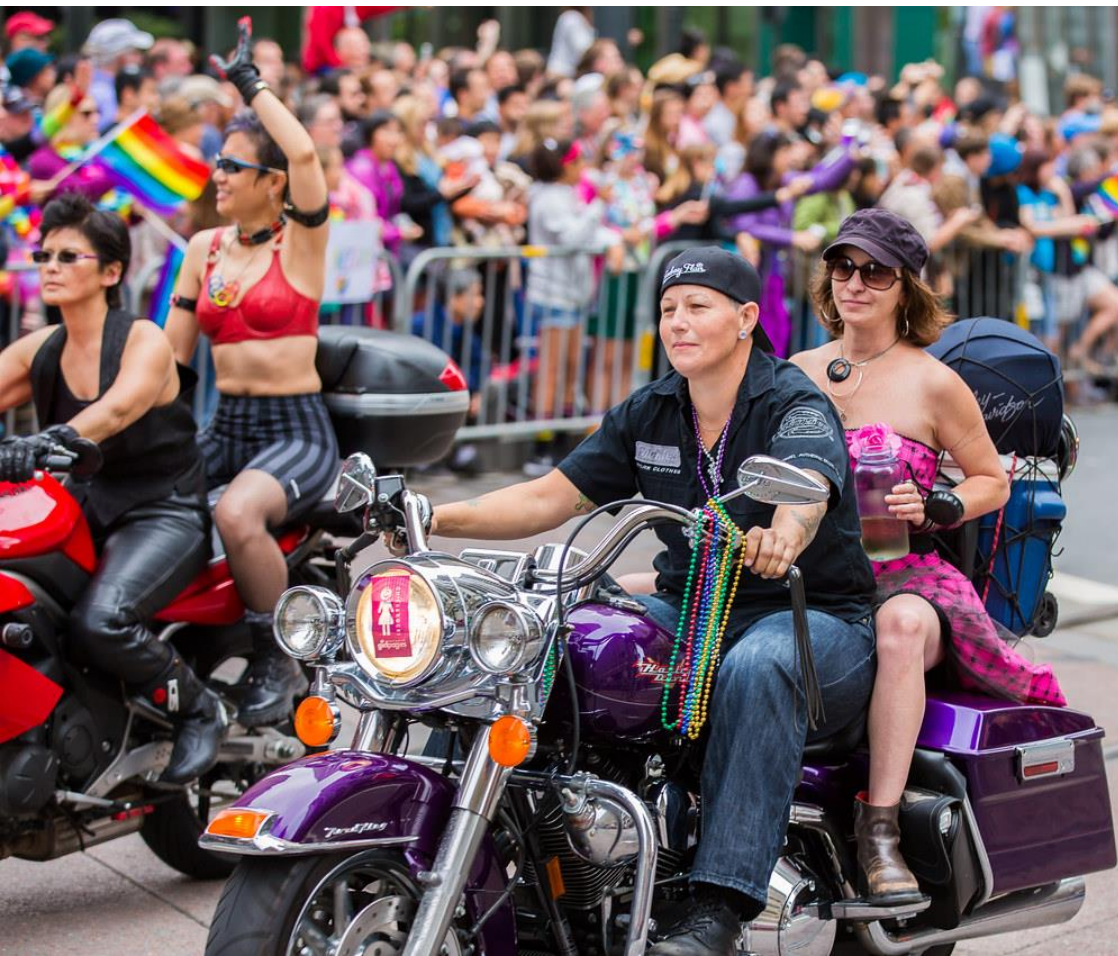
Dykes on Bikes, San Francisco Pride 2015