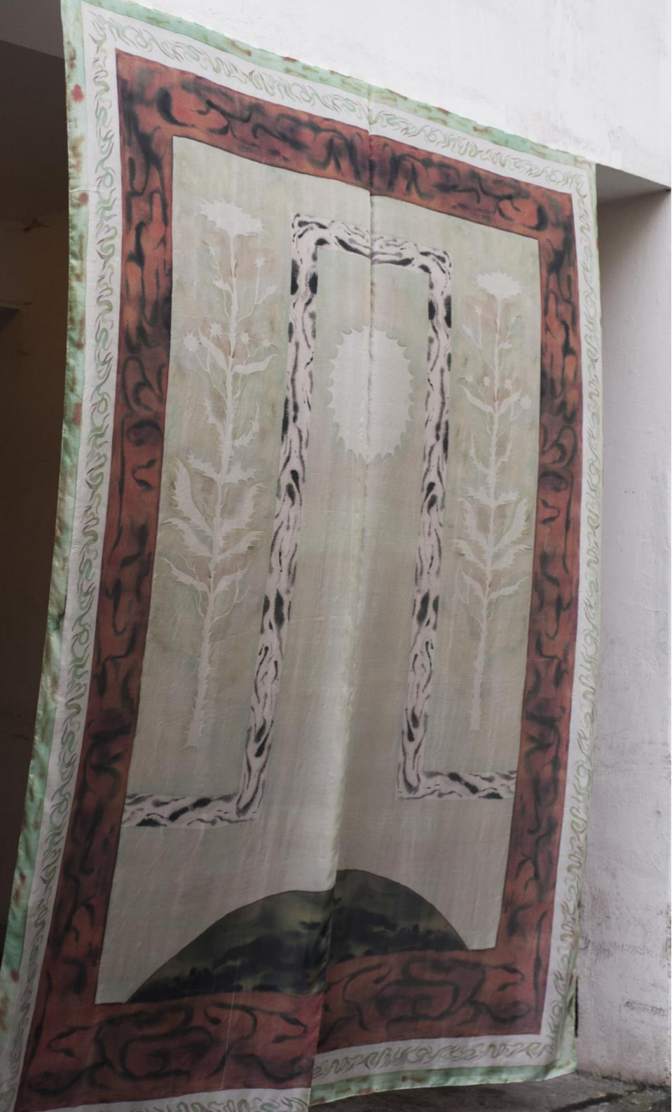
Teaterteppet, reaktivt digitaltryk på silke, 200 x 320 cm, 2023