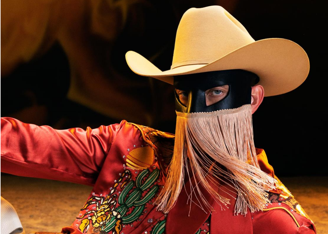
OVER: Musiker Orville Peck UNDER: Musiker Lil Nas X