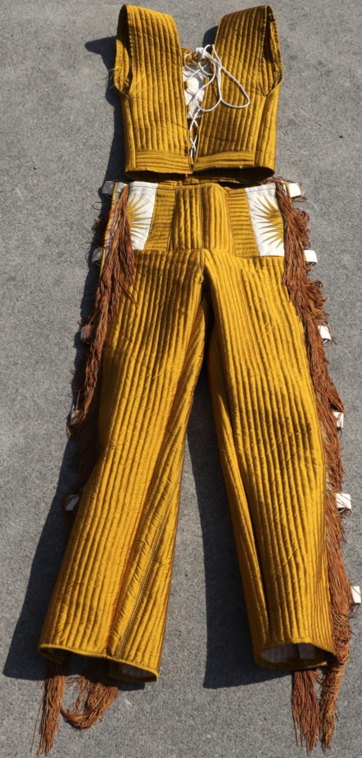
Venusbunad I, Løver, (verket er fortsatt under produktion) tekstil, metal, silkeprint, 2024