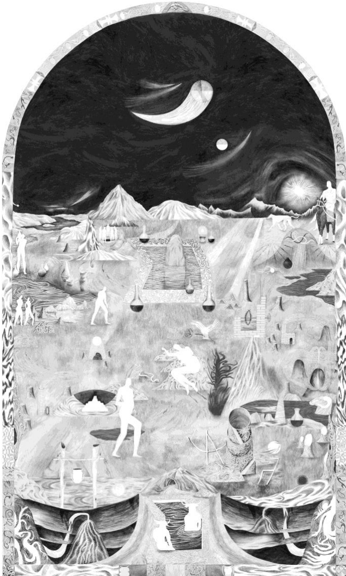
Clear Channel , grafittegning, 150 x 230 cm, 2023 (eksempel på mit arbejde med World Building i tegning)

mig i retning af fantasy og rollespil. Kunst og rollespil har det til fælles at de begge tilbyder muligheden for, at skaber verdener, man kan træde ind i, prøve sig selv af i, og måske endda vende tilbage fra, forandret.