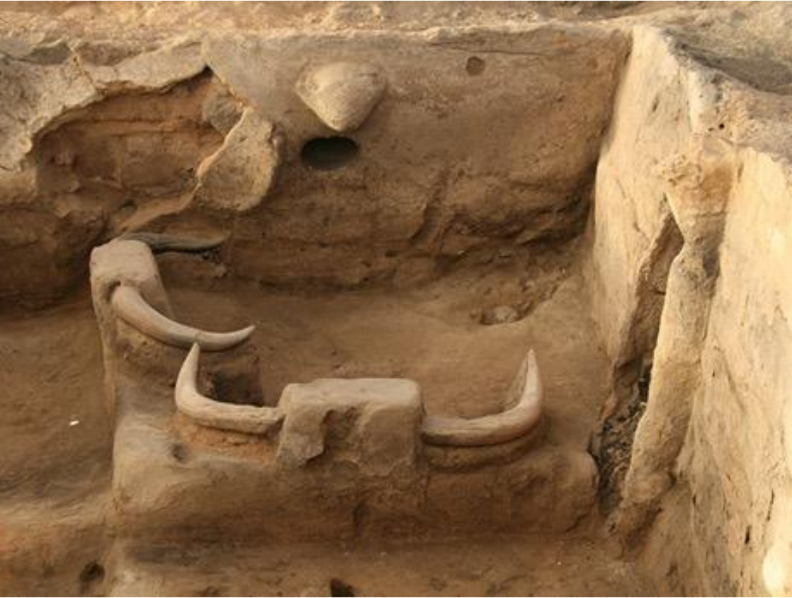
Udgraving av byen Çatalhöyük (av Anadolu University)