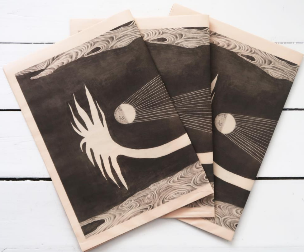
Et Godt Sted at Våkne , avis i oplag på 400, 2021, 84 x 420 cm

verden og spør hvordan myter gennem historien er blevet ned- og omskrevet for at bygge op om særlige interesser og samfundsstrukturer. Avisen blev trykt på en rest af akkurat det samme papir som den konservative danske avis, Jyllandsposten, er trykt på. Jyllandsposten var den dominerende avisen i det heteronormative samfund jeg voksede op i. Personligt var dette også en mulighed for at trykke en fortælling jeg, som skeiv ungdom, havde savnet, på akkurat det papir som min barndoms sandheder var trykt på.