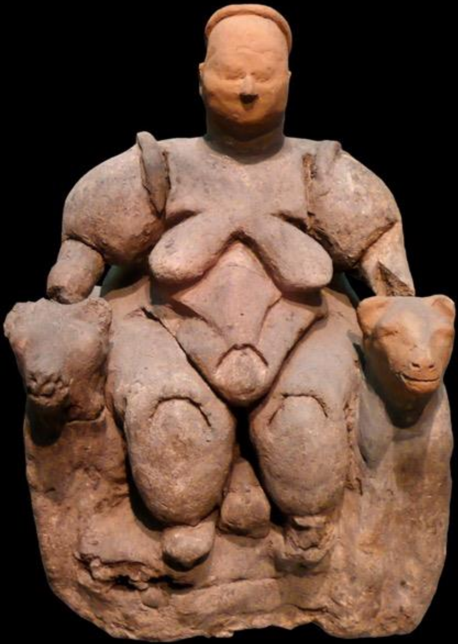
Sittende kvinne fra Çatalhöyük (hodet er en restaurering) Museet for Anatoliske Sivilisasjoner