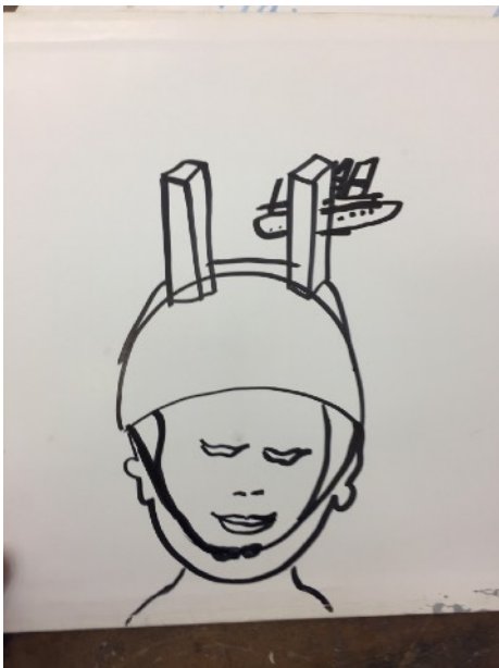
Utan titel, 2018

frasen kom ur, som ”Ska vi på återträffen” har plockats upp. Det är frågan om vem som lyssnar, vem frasen träffar som är den bakomliggande inspirationen, men nu när de är giltiga är det deras kvalitet i vikt, tryck, grå-mängd som bestämmer deras plats i en komposition. Intresset i ”vem som lyssnar, vem frasen träffar” är inte viktig längre.