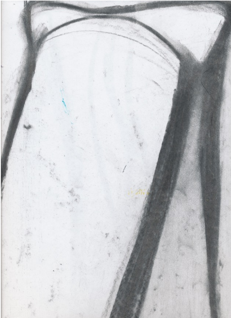
Tidigare ikväll under en performance pekade jag på hörnen i rummet vi var i, blötlade limmet. Ovan en kolteckning från 2015