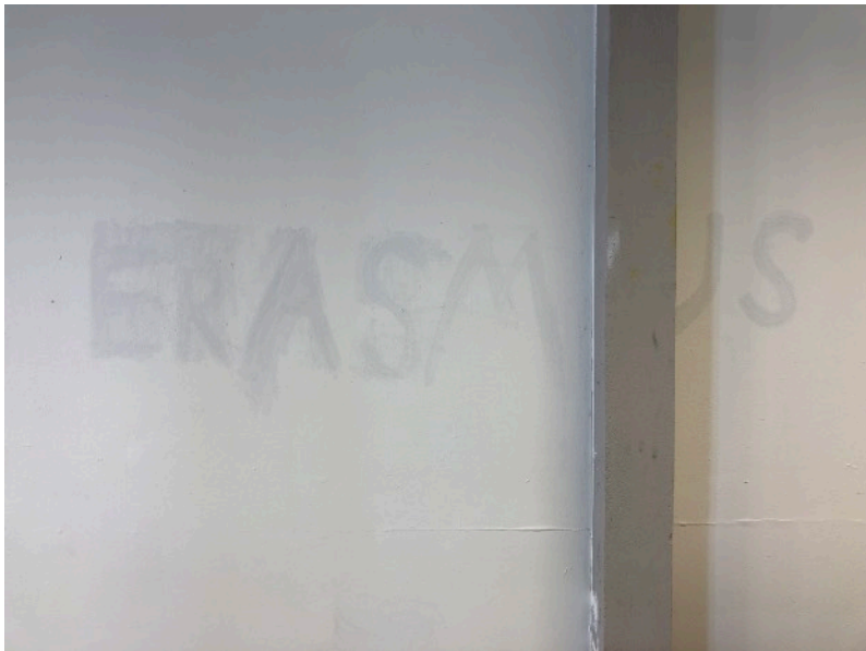
Väggen i min studio, 2021

rum inom väggarna). Vi har bordet, ”modellen” som antar position, kan bestämma skala. Det är svårare att låta ”Bush did Titanic” bestämma skala. Bara genom processen av medborgarförslag kan kombinerade minnesmärken bli verklighet. Där blir liggsåret kännbart. Från strukturens mitt. Långsamt svängande rörelser. Medborgarförslaget har den gråa karaktär, tröghet, potentiell paranoia från farliga förslag som jag lutar mig mot när jag möblerar inför en kommande presentation.