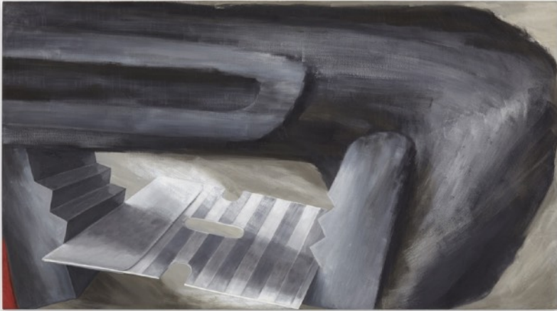
Lee Lozano, untitled, 1964