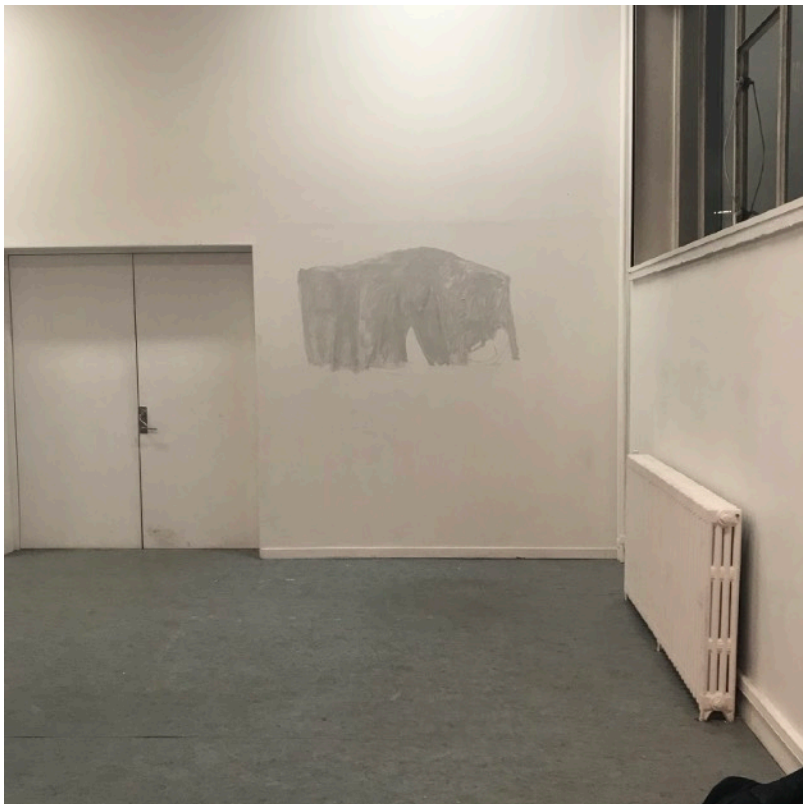
Utan titel, 2020

Fraserna jag använder har oftast fastställts som giltiga i en slags lat, passiv överlämning, en tillåtelse att leva vidare som en fixering tills vidare. Där finns en stilla nyfikenhet om varför de tog sig igenom, blev kvar. Blir liggande. Jag vill ha grå berättelser, gråa bilder. En rik grå ton, buljong. Szechuan-peppar, blomdoft. Potent smak, oval smak på berättelser, oval smak på ord (ett tillräckligt nednött rektangulärt bord har fått en oval form).