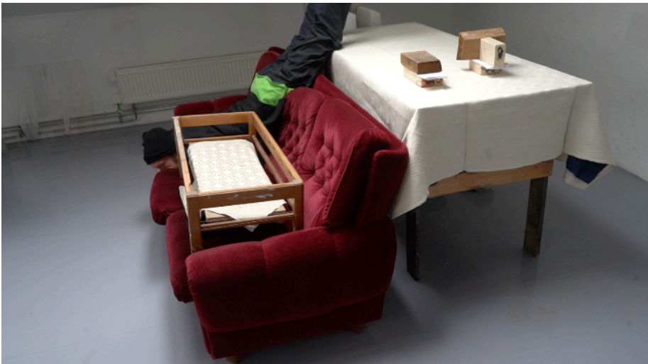
Ett åtagande i bruten kropp. Stillbild från en invitation i video-form från tidigare i år

Frågan fastnar i rummets alla hörn, bygger sitt näste där varje linje bryts, där varje vägg viks. Från en performance tidigare idag pekade jag direkt på den här bilden, att frågan om rummet sitter där ramen ändrar riktning, i hörnen. Där hålls ramen ihop, där vill jag peka, från rummets svagaste punkt.