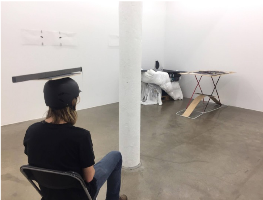
Här väntar jag i No Anti-precision Both , 2019