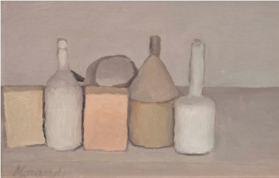
Giorgio Morandi, Still Life , 1955