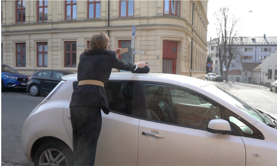
Här lägger jag en träbit med ordet "Erasmus" skrivet på, på ett biltak, med en hopvikt byxa mellan träbiten och biltaket

Bromsen ska ligga i från start, bunden. Bältet i bilden håller mig bunden, bromsar mig från sekvensens start, till slutet.