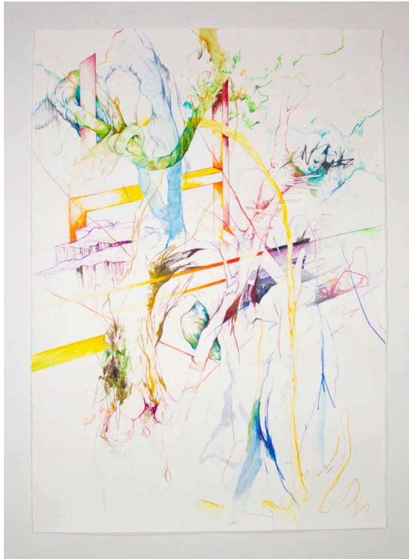
«Scaffolding» 2021, Tegning og akvarell på papir. 100x70 cm.

For å bygge dynamiske strukturer kreves det ofte luft og romlighet mellom formene. Ved å dvele over tomrommet mellom materialene blir det immaterielle håndgripelig, og tomrommet blir et materiale i seg selv. Det skapes negative former og det oppstår dialog mellom arbeidet og bakgrunnen. Rå og fuktig leire søker naturlig bakken hvor den kommer fra, og man må derfor samarbeide med den for å kunne gi den et løft. Når man bygger for hånd starter man fra bunn og bygger seg oppover, en pølse om gangen som man bearbeider inn i hverandre til en jevn vegg. Man bygger en del om gangen og lar den bli tørr nok til å holde seg selv oppreist, men samtidig fuktig nok til å kunne koble på neste del. Under brenningen sintres den tørkede leiren, den blir på nytt ustabil og tyngdekraften blir igjen en faktor man må ta med i beregningen. Tyngdekraften begrenser hvor skjørt man kan bygge før strukturen kolliderer. Med kunnskap om det keramiske håndverket, og i kombinasjon med andre materialer kan man utfordre tyngdekraften for å oppnå en letthet i det keramiske materialet.