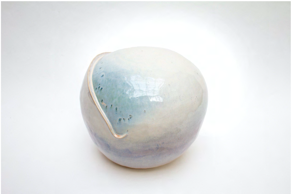
«Stær» 2022, glassert stengods. H29cm Ø106cm.

På grunn av keramikkenes natur og vilje defineres ofte formuttrykket av materialets tyngde og hvordan man håndterer leiren gjennom dens stadier. Hvis man ønsker et kontrollert resultat, er den mest stabile formen en sylinder med solid bunn og jevne vegger som støtter seg selv opp gjennom sine plastiske stadier. Det ligger derfor en grunnleggende referanse til beholderen i det keramiske uttrykket som kan være krevende å jobbe seg forbi. I begynnelsen av min keramiske praksis ble den definerte bunnen et tilbakevendende problem i møte med min tidligere praksis. En friksjon med mine tegninger på papir og installasjoner i rommet hvor jeg bygget et fragmentert, romlig uttrykk med svevende former og linjer. Jeg ønsket å utfordre leirens vilje og trosse tyngdekraften for å lage objekter uten et solid fundament slik keramikken ofte har. Til slutt kunne jeg kontrollere vanninnholdet i leiren og jobbe meg rundt problemet. Jeg fikk en forståelse av hvordan jeg skulle opprettholde plastisitet i leiren, men samtidig tørke den ut nok til at jeg kunne bygge former som løftet seg fra underlaget.