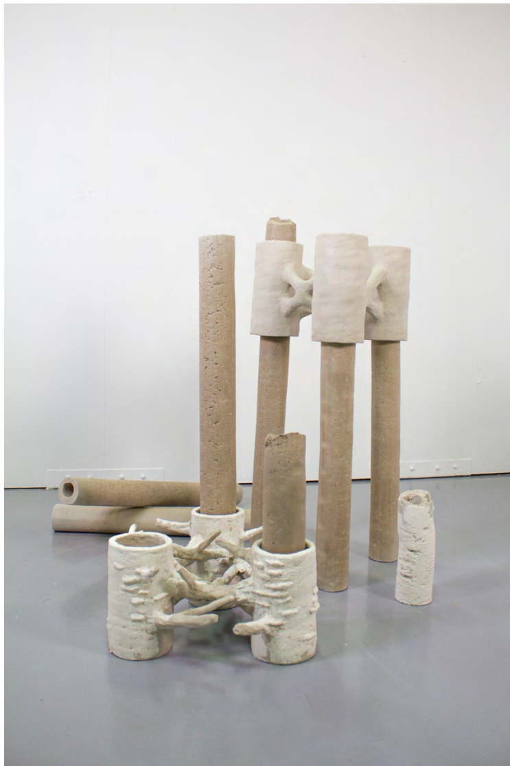
Bilde av arbeid i prosess (2021). En utforskning i hvordan jeg kunne bygge moduler som etter brenning kan settes sammen på ulike vis.

bindepunkter, bindeledd, lås, vedstabler, en varde, byggeklosser, telt, gapahuk, puslespill, og så videre. Jeg begynte å utforske hvordan keramiske moduler forholder seg til andre materialer som for eksempel treverk. Ved å reflektere over objekters form og materialitet kan jeg skape kontraster og relasjoner gjennom deres kvalitative egenskaper. Ved å dvele over et objekt eller et materiale kan jeg finne egenskaper som kommuniserer med et annet. På denne måten kan alt kobles sammen i uendelige rekker, selv om et individuelt fragment aldri henger sammen med alt på en og samme tid.