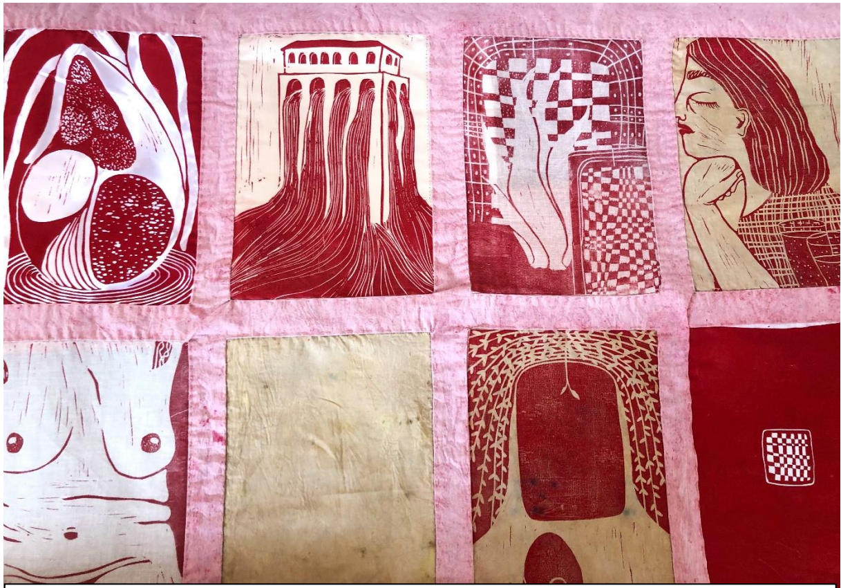
Nærbillede af Skygger og bløde ting . Linoleumstryk på tekstil. Af Mathilde Borsholt. 2022