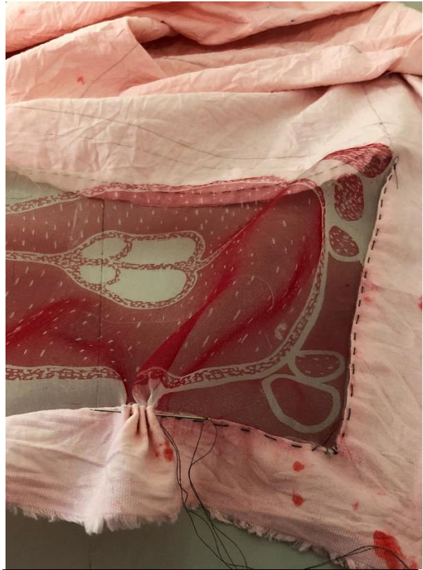
Proces-billede, linoleumstryk sys fast til stof. 2021