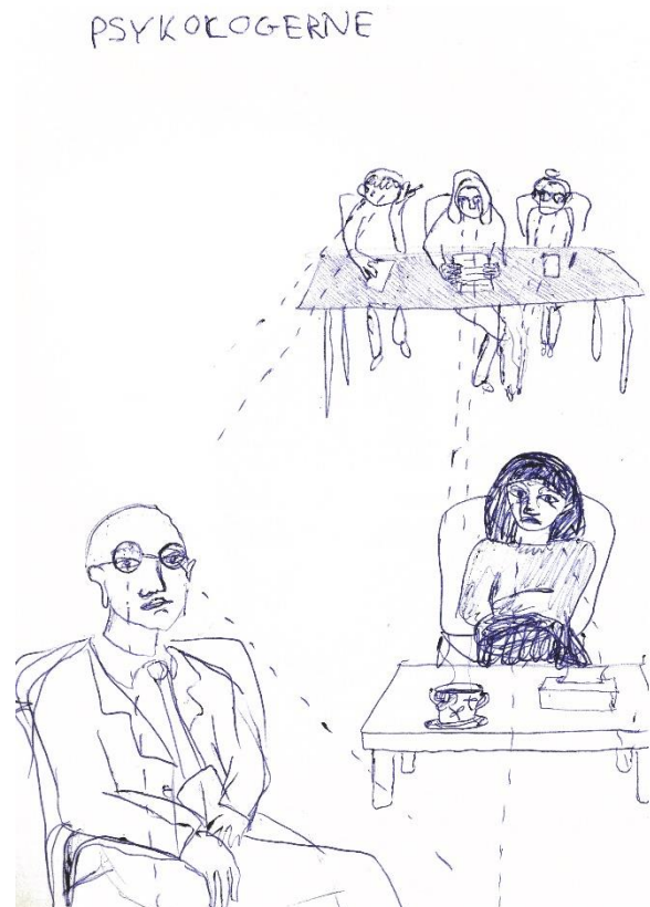
Psykologerne. Tegning fra tegnedagbog. Kuglepen på papir. 21x15 cm. Af Mathilde Borsholt. 2020

Jeg fandt på et projekt som har tiden, gentagelsen og det umiddelbare i en hurtig tegning som omdrejningspunkt. Jeg har hele tiden regnet med mit eget nærvær som det bærende element i projektet. Jeg har sat mig ned hver dag og prøvet at være til stede i øjeblikket, at trække noget ud af det. Jeg har ikke regnet med mere end at dokumentere min egen forvirring, til gengæld ville jeg gøre det så godt jeg kunne. Jeg har trykt alting i rød, da det giver en kropslighed til værket, som er vigtig. Det er min krop i et rum i en tid, og hvad viser det bedre end en lang kødfarvet collage?