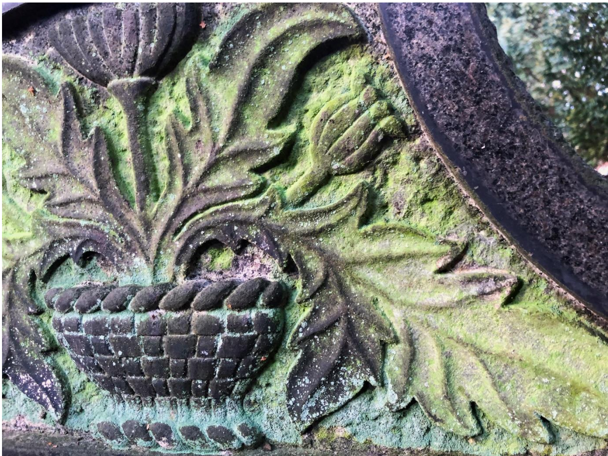
Inspirations-billede, mos på en gravsten på Assistens kirkegård. 2022

Natursansninger bliver som en medicin imod det, Camus nok ville kalde det absurde. I mit arbejde er jeg af samme grund meget optaget af materialer og teksturer. At bearbejde materialer er en måde at snakke med verden på. En måde at føle sig virkelig på. For tiden går jeg en tur på Assistens kirkegården hver morgen, her finder jeg tit inspiration i planternes former og farverne på det mos, som gror på gravstenene. Nogle dage kan naturen bringe mig i en særlig tilstand af fuldstændigt nærvær. Kunst kan have den samme effekt på mig. Det er nok derfor jeg har valgt at arbejde materialebaseret. I håb om at trække beskueren af mine værker ind i nuet, igennem materialernes sanselighed.