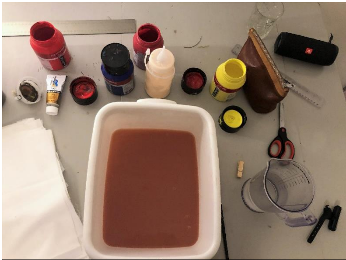
Proces-billede, farvning af tekstiler. 2022

som sidder lidt forkert, et materialevalg som virker lidt mærkeligt, en salmesang i midten af et britpop album. Jeg synes derfor også, at linoleum passer godt til mit projekt, da linoleumstryk er meget kontrastfyldte, har et hårdt udtryk, som minder om propaganda plakater. Det, jeg prøver at udtrykke, er svævende og følsomt. Jeg kan godt lide den udfordring, det er at få noget følsomt ud af linoleummet.