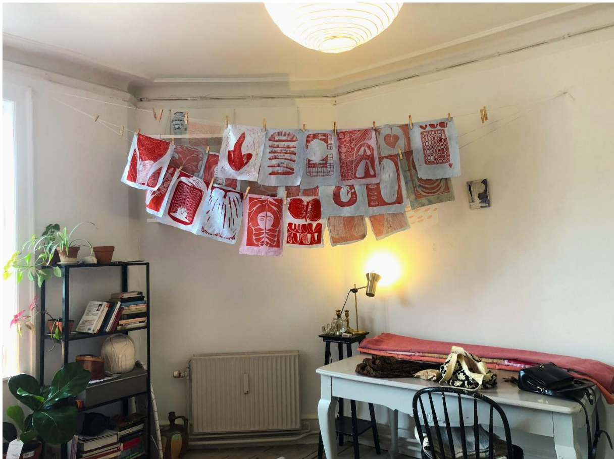
Proces-billede, linoleumstryk hænger til tørre på mit soveværelse. 2022

En gang i november satte jeg ved arbejdsbordet med plader af linoleum, blyanter og snittegrej. Min ambition var at være nærværende, at prøve at fange nogle af de fornemmelser, som gemmer sig i min krop. Et sted, hvor musklerne trækker sig sammen ved en ubehagelig erindring, en spændingshovedpine og et rum, hvor noget snurrer rundt og rundt. Jeg prøver at fange noget ordløst. Det sidder tit i sanselige oplevelser. Skyggen fra mine planter på væggen, kroppen, alle de kilo kød, som bearbejder linoleum, pasta, en cykel. Og bliver bearbejdet af bakterier, signalstoffer, lysbølger, hænder. Når jeg sidder og skærer, indfarver en plade, langsomt trækker et ark papir af den, kan jeg mærke, at min krop er en del af verden. At den er kød, et materiale i forening med alle andre eksistenser.