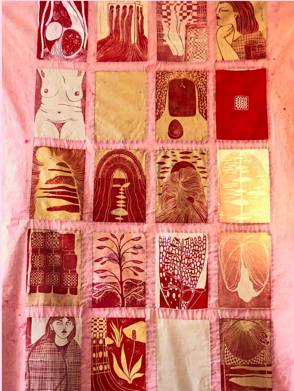
Skygger og bløde ting. (2022). Linoleumstryk på tekstil. 110x250cm. Af Mathilde Borsholt

Af Mathilde Borsholt, Grafik og tegning, KHiO, 2022