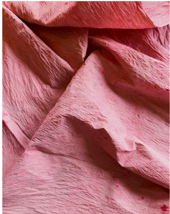
Proces-billede, farvet stof. 2022