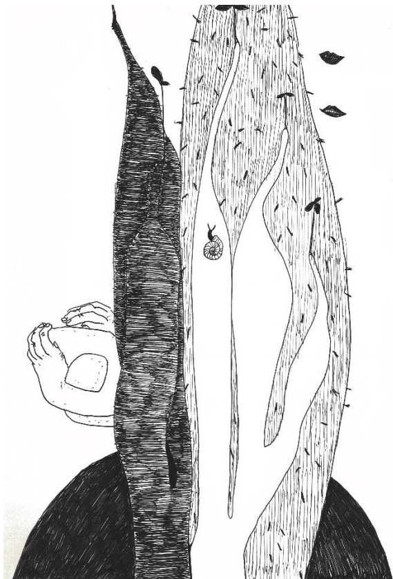
Uden titel. Tegning fra tegnedagbog. Kuglepen på papir. 21x15 cm. af Mathilde Borsholt 2019

en tegning om dagen i en bog, jeg selv bandt. Ved at lave en fast ramme om projektet, fjernede jeg forventningerne til hver enkelt tegning. Hver tegning behøver ikke at være god, da de jo er en del af et større billede, som viser noget om, hvad der fylder for mig over tid. Da efteråret 2021 kom, blev jeg nervøs, jeg ville gerne lave kunst igen, og jeg ville gerne færdiggøre min bachelor, men jeg ville ikke tilbage til vindhekse-følelsen. Så hvordan kan jeg komme i gang igen? Med en tegnedagbog selvfølgelig!