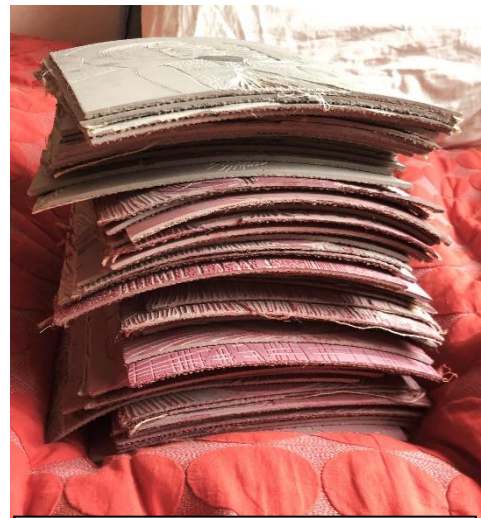
Proces-billede, stak af linoleumssnit. 2022