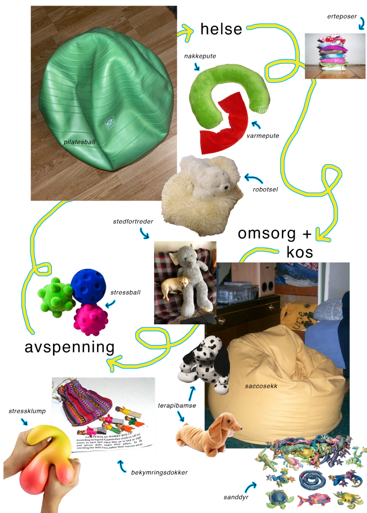
Fig. 4: Diagram over helsebringande mjuke formar, 2021

Den digitale versjonen av forskinga fekk ein oppføljar, veslebroren kva er klump??? , som går eit bittelite hakk meir konkret til verks og tek føre seg dei mystiske mjuke formane. Dei mjuke klumpaktige formane kjenner vi att frå naturen, frå kroppen, frå havet – men dei er også ofte å sjå i det litt terapeutiske landskapet. Dei organiske formane verkar å ha noko iboande omsorgsfullt ved seg.