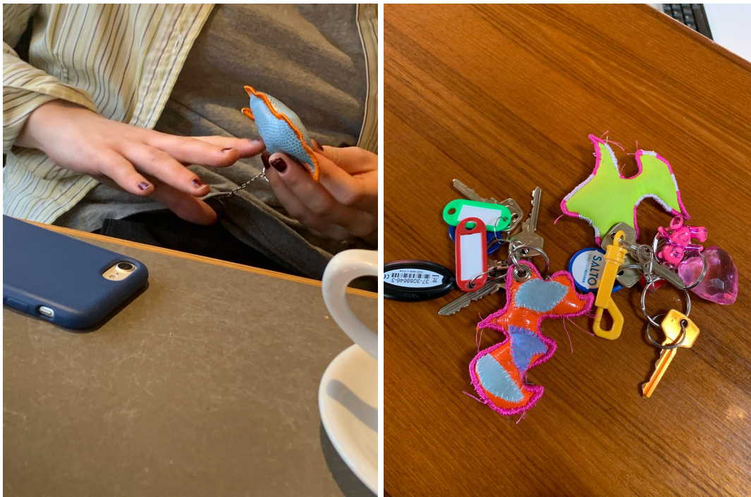
Fig. 6-7: Nøkkelringar på oppdrag, 2022

Ettersom mange av nøkkelringane ein eig har ein sentimental verdi i det at dei har kome oss i hende i form av gåver kjentest det naudsynt å leggje til rette for at også dei handlaga nøkkelringane kunne knyte band til menneske og situasjonar for å tileigne seg sine egne erfaringar. Kvar og ein av dei har derfor på eit tidspunkt vore utplassert hos ein utvald person, og gjennom ein periode i nokon sitt eige samla opp inntrykk og opplevingar den kan bere med seg inn i utstillingsformatet. Ved overlevering til sin nye eigar vart det ikkje lagt noko føringar for korleis gjenstanden skulle behandlast eller kva informasjon som skulle følgje med han når han vart returnert. Det einaste kravet var at han skulle returnerast innan av slutten av april. I skrivande stund, i byrjinga av april 2022, har nokre av dei kome tilbake til meg medan andre framleis er ute på oppdrag. Ved tilbakeleveringa har samtlege av dei nye eigarane uoppfordra fortalt meg om korleis dei har opplevt å vere i tingen sitt nærvær, kva han har vore med på og korleis relasjonen mellom menneske og ting har vore.