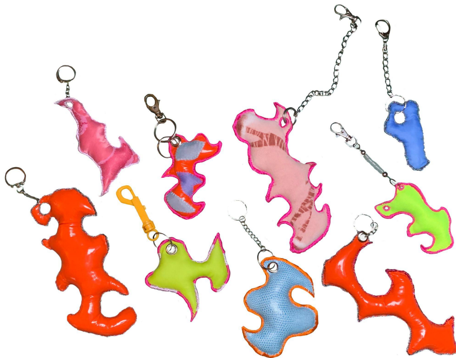
Fig. 2: Ei samling nøkkelringar, klare for sine respektive ekspedisjonar

Verket består av ei samling nøkkelringar som eg personleg knyter meg til. Mange av dei har eg samla gjennom livet og dei fleste av desse har på ulike tidspunkt vore festa til nøklene eg har hatt behov for i det daglege. Enkeltvis representerer kvar og ein av dei ulike tidspunkt, plassar, relasjonar og kjensler. Saman utgjer dei eit slags arkiv av ulike fasar i livet, bygga opp av minner og assosiasjonar knytt til den enkelte nøkkelringen sitt opphav og bruksperiode. Sjølv om akkurat desse nøkkelringane er gjenstandar eg personleg identifiserar meg med og har eit forhold til, har dei noko så ekstremt allment gjenkjenneleg over seg at dei på same tid framstår som universelle.