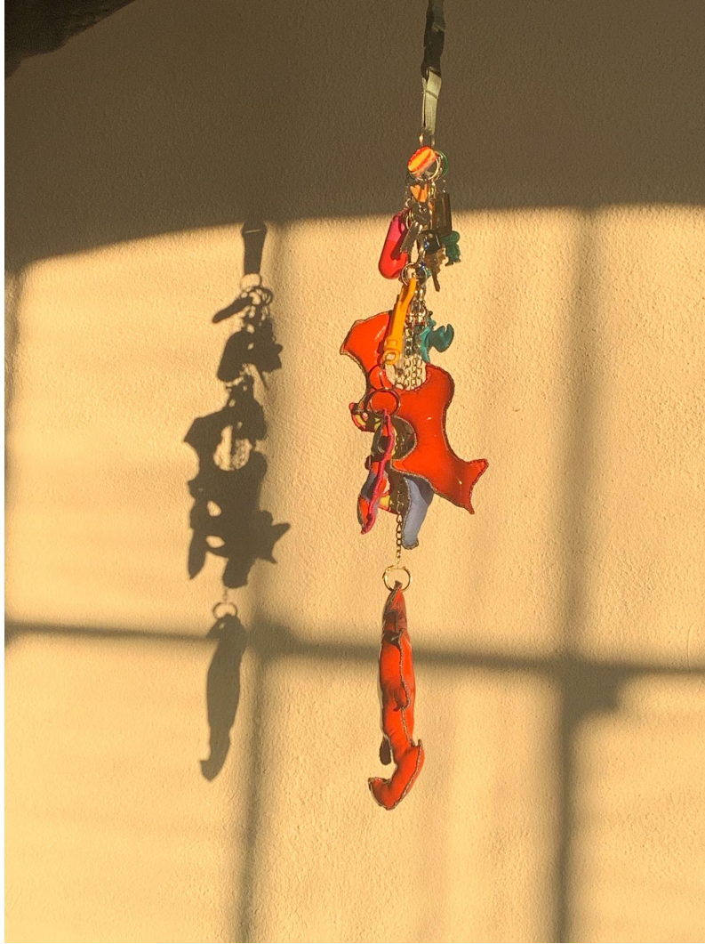
Fig. 1: Nøkkelringar i prosess, 2021