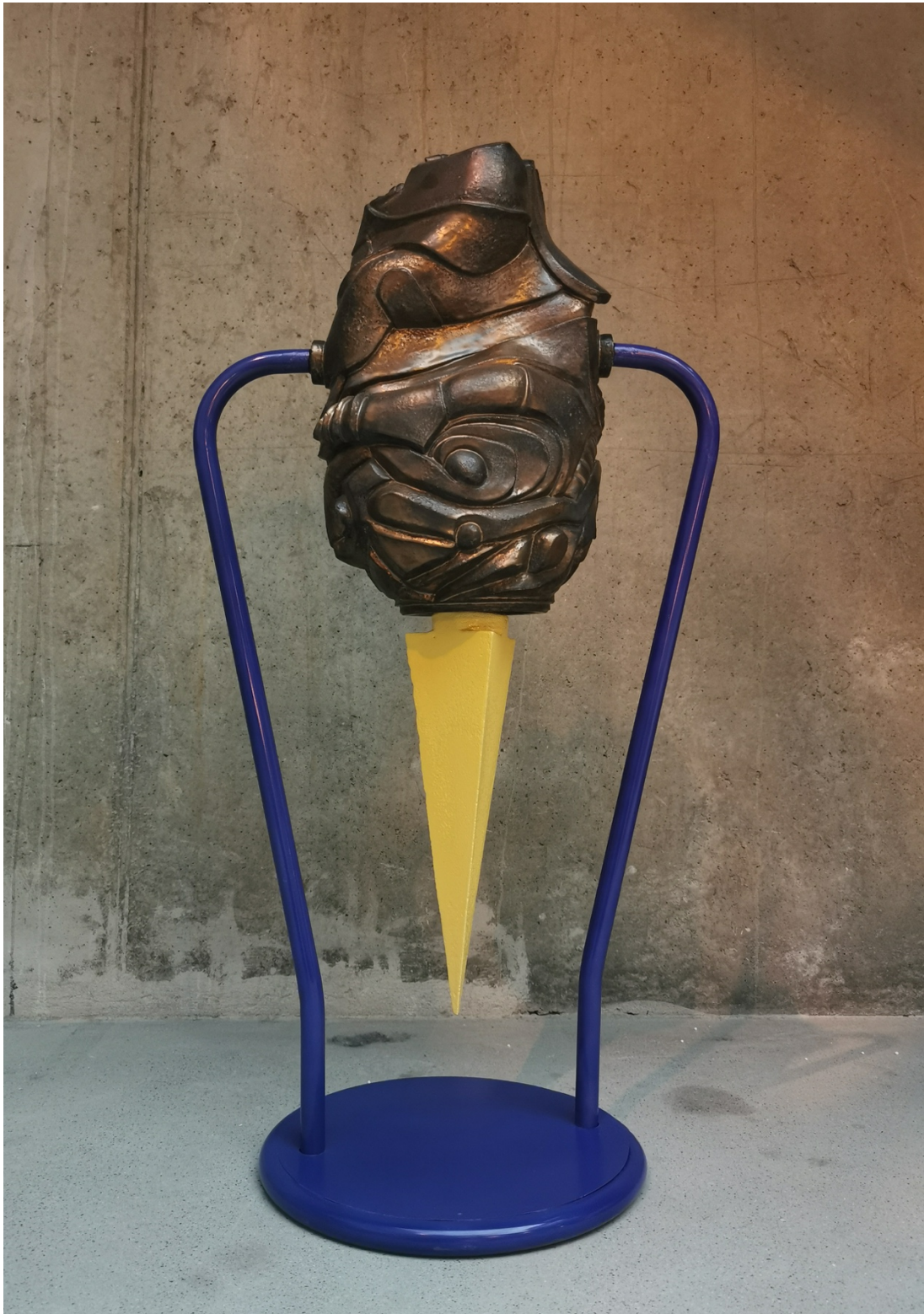
Fra serien Epistemiske Objekter , Jens Thygesen, 2022.

Glaseret stentøj og lakeret stål, 110 x 60 x 35 cm