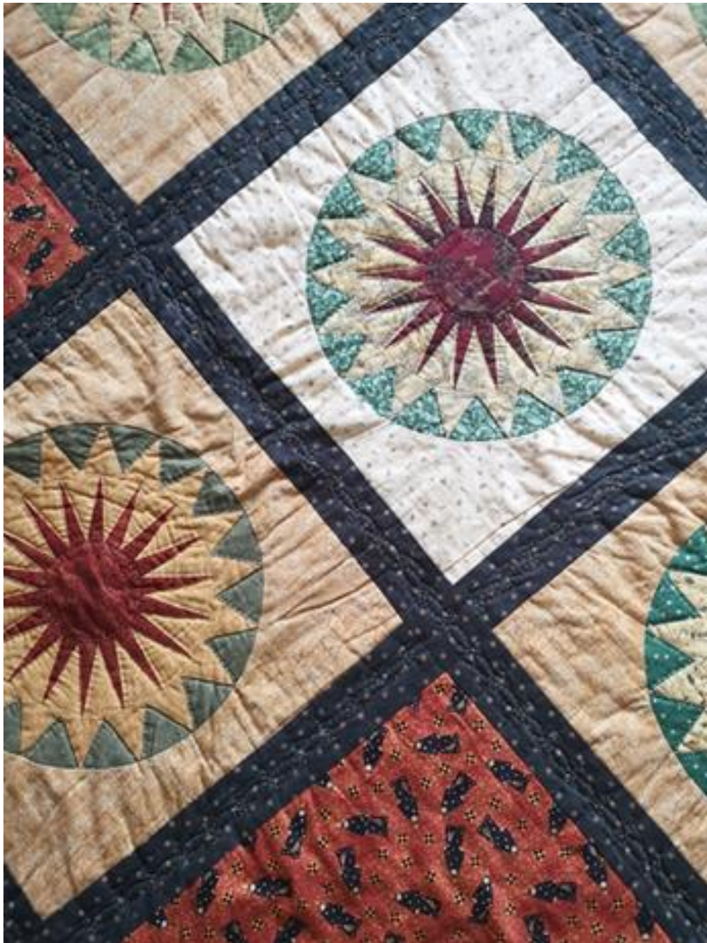
Detalj fra et håndquiltet sengeteppe som moren min har lagd til meg.

Jeg er interessert i psykologiske mønstre, og hvordan dette har påvirket og påvirker de kommende generasjonene i familien. Prosjektet kan forstås som en utforskning av identitet forankret i erfaringer og minner, undersøkt og fremstilt gjennom det tekstile håndarbeidet. Å sy, strikke, brodere og hekle kan forstås innenfor prosjektets kontekst som et vis å arrangere og mestre livet sitt på. Håndarbeidet benyttes for å fremheve fortellingen. Tekstilet blir «arket».