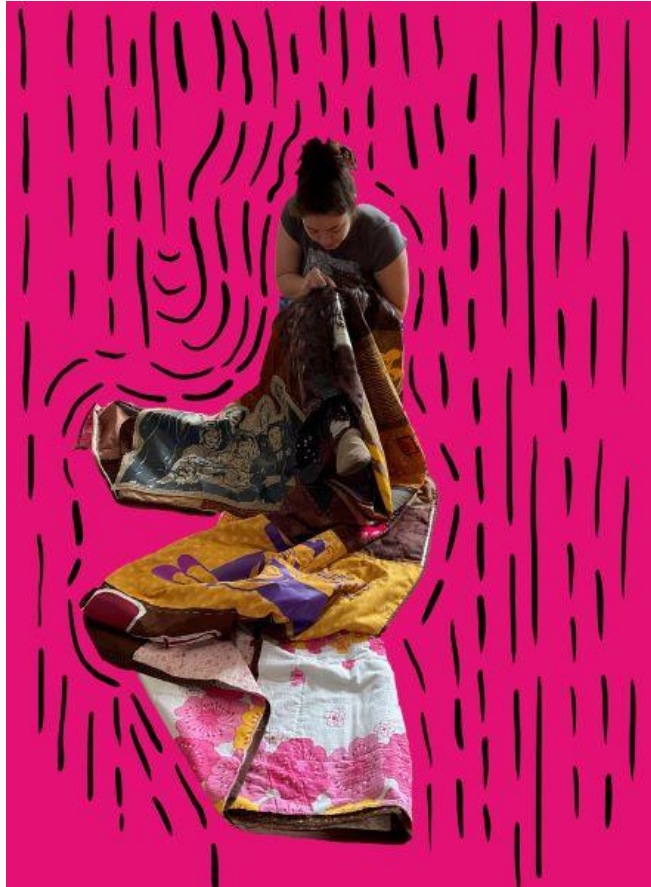
Neeva håndquilter, april 2022. Digital tegning på foto.

Deretter ble en lukkekant påsydd for hånd, noe som også var et tidkrevende arbeid. Her ble venninner invitert til å delta/hjelpe til som et sosialt samvær hvor vi jobbet, spiste, drakk og oppdaterte hverandre om livet. Denne sosiale formen kan knyttes opp mot det sosiale og symbolske fellesskapet quiltingen har hatt og fremdeles har.