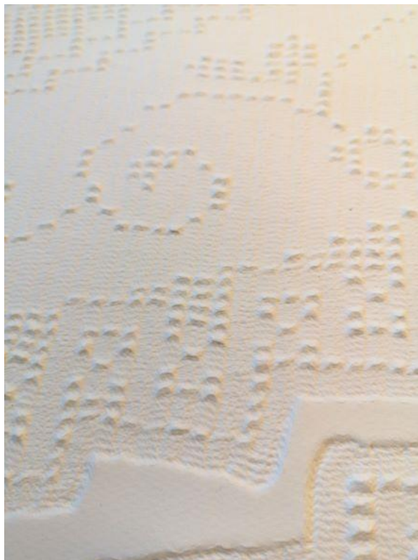
Blank relieff, detalj, kollografi laget av min mormors heklede duk, 2021.