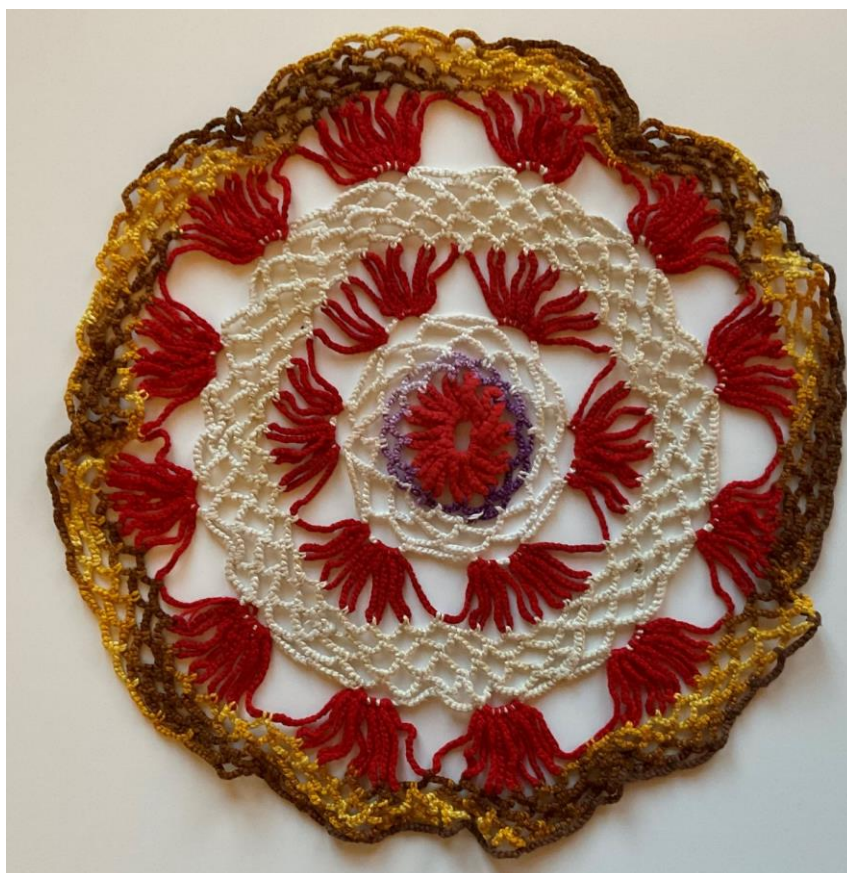
Heklet duk av min mormor. Denne fikk jeg i 6 -7 års alderen. Jeg husker at jeg syntes at dette var en rar gave til ett barn.