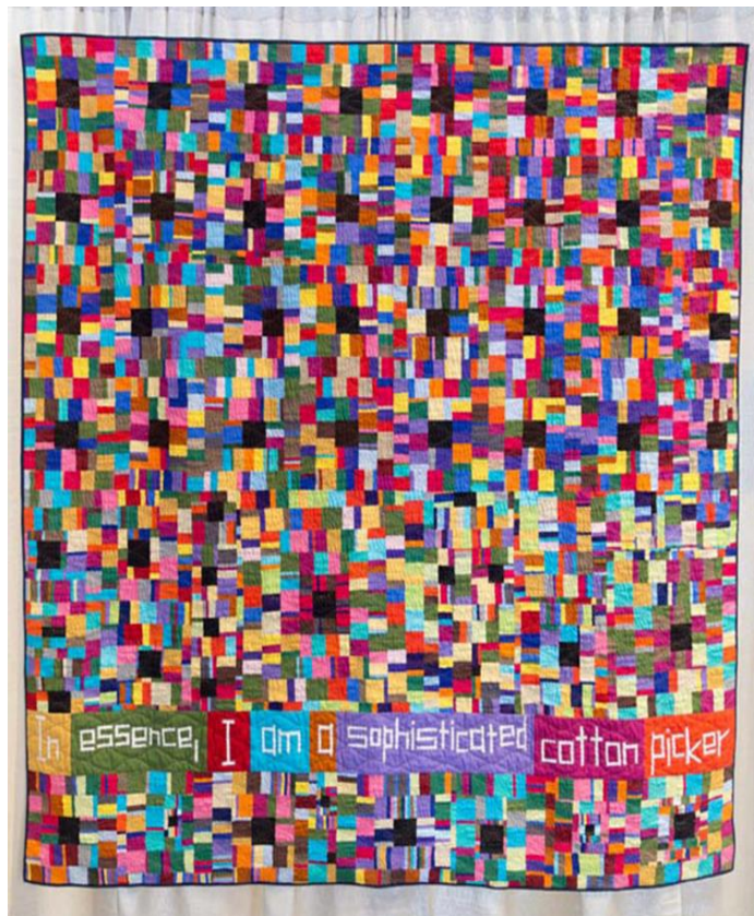
Chawne Kimber, Cotton Sophisticate , 2015, tekstil, tråd, 165 cm x 165 cm.