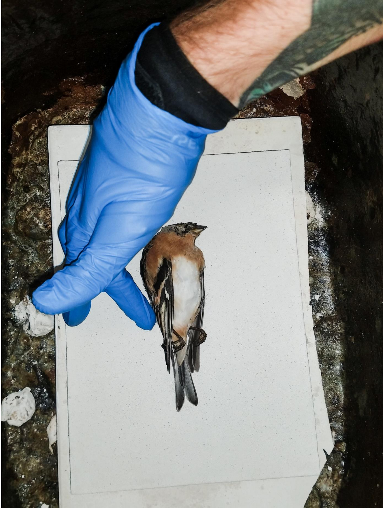
5 Prosessbilde: Kremering av bjørkefink på flis