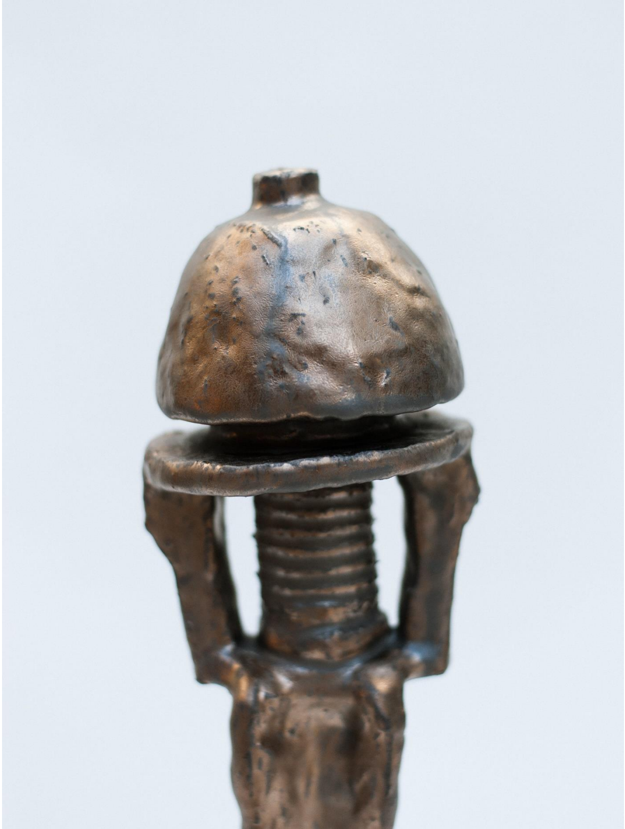
12 Detaljilde: "uten tittel", 2022, steingods, glasur. 50x17x17 cm.