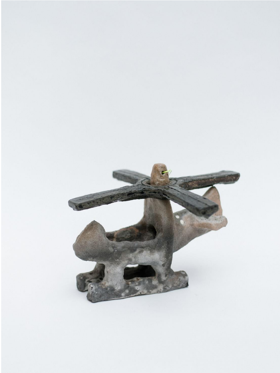
13 "Little Bird", 2021, muffelbrent steingods, 15x10x12 cm.

markerer fare - det er bare en øvelse - men de gir et hint om at freden og hverdagen ikke er definitiv. Helikoptrene ser en. De er innimellom fascinerende nære, til og med. Stort sett er de utsendt fra sykehus og redningstjeneste og melder om ulykke og død, som moderne ravner. Man spekulerer et øyeblikk over hva som har hendt, før en vender tilbake til jorda og tråkker videre.