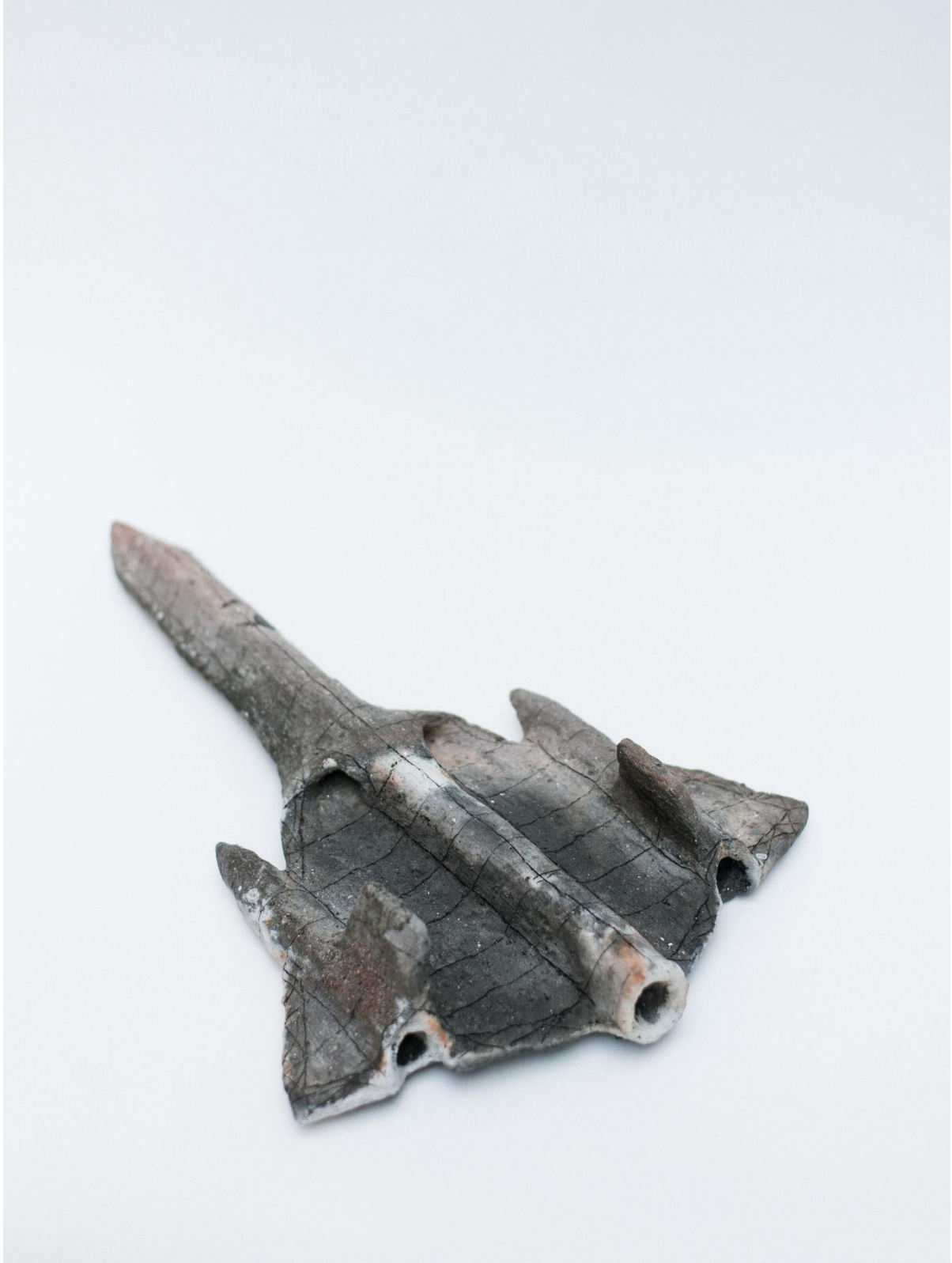
11 "Blackbird", 2021, muffelbrent steingods, 40x17x8 cm.