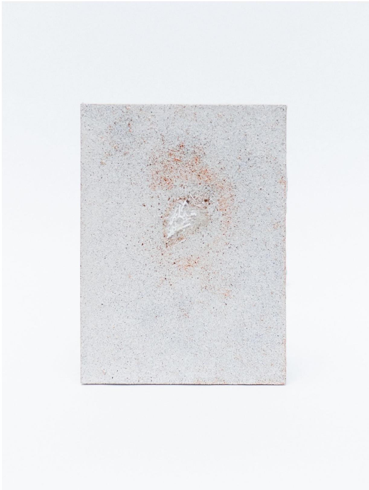
6 "Fugleperspektiver no. 6", 2021, muffelbrent steingods, fuglelikglasur, 17x13x1,5 cm.