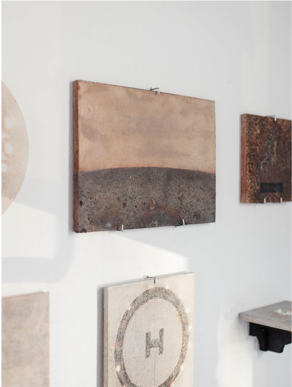
14 Utsnitt av installasjon fra «Heavy Birds»-utstilling: "Fugleperspektiver no. 1-6", 2021, muffelbrent steingods,