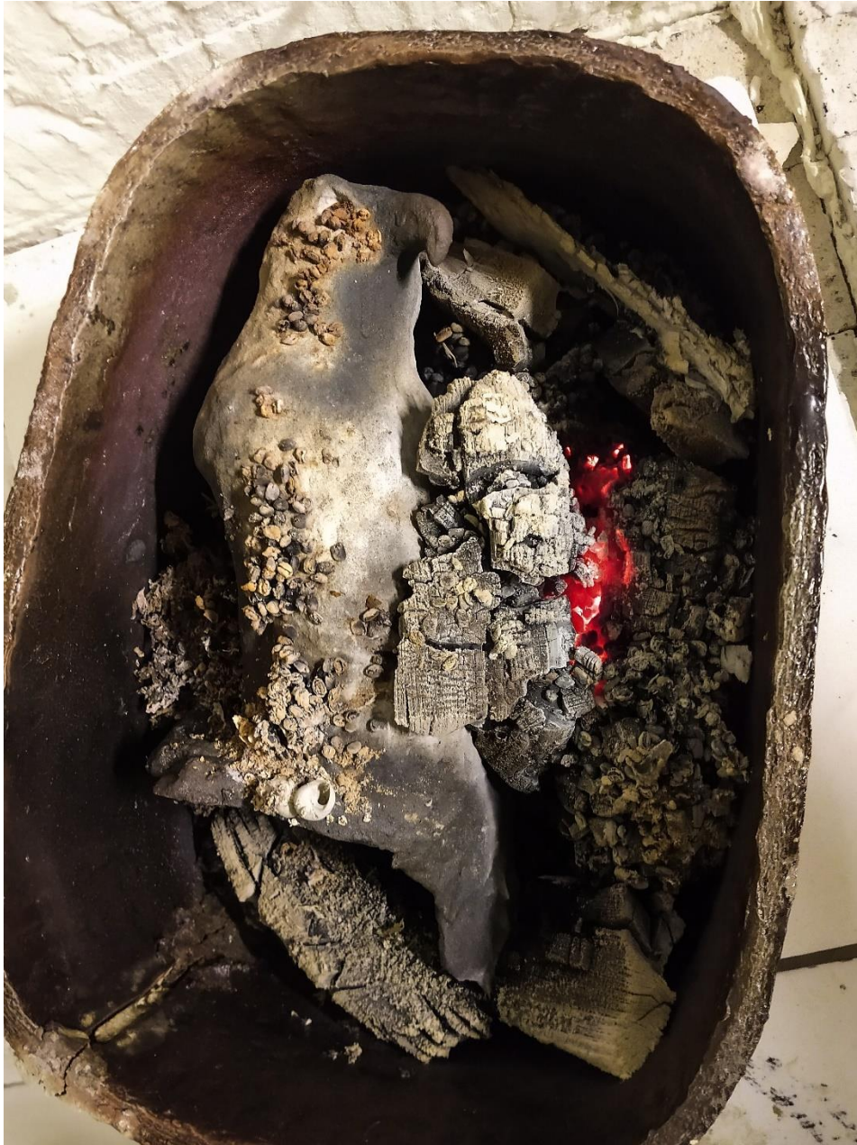
7 Prosessbilde: Åpning av muffel med fugleskulptur i.

“Aesthetically, these sculptures are simultaneously primitive and contemporary; objects of human culture which appear as if lost and found, seeming to confirm the supremacy of nature’s order over the world of mankind.” (- Lisson Gallery, 2021)