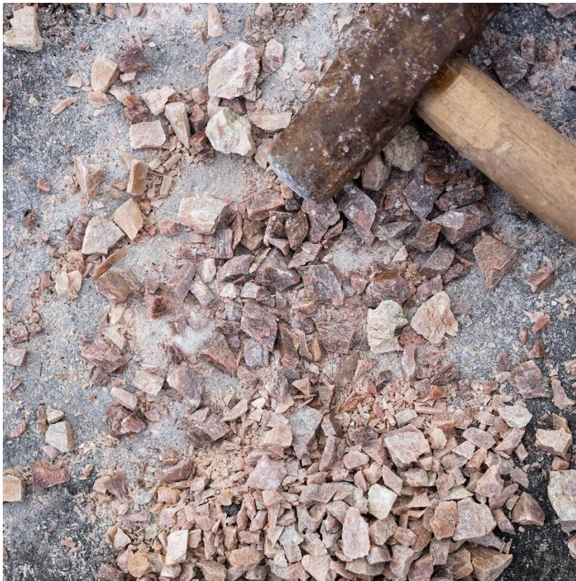
3 Prosessbilde: Knusing av kalifeltspat, med sin karakteristiske kjøttaktige farge og tekstur