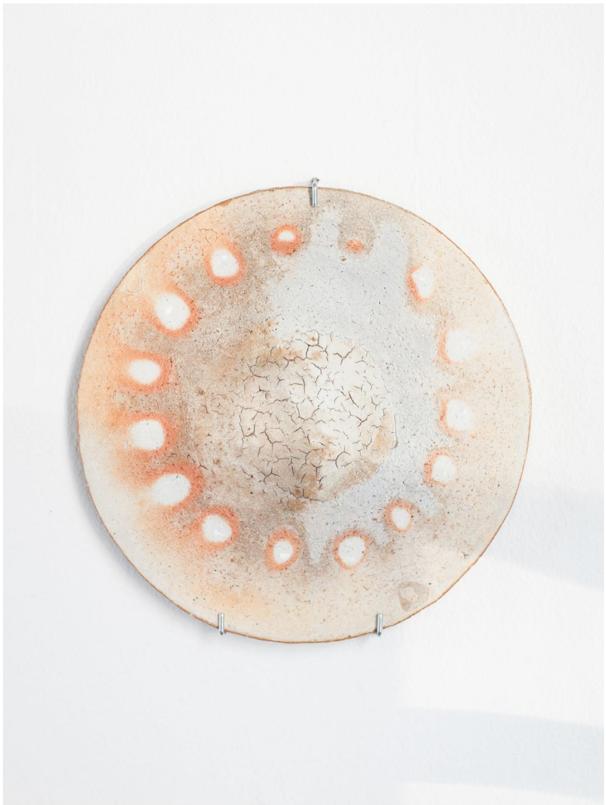
2 "Fugleperspektiver no. 1", 2021, muffelbrent steingods, 30 Øx1,5 cm.