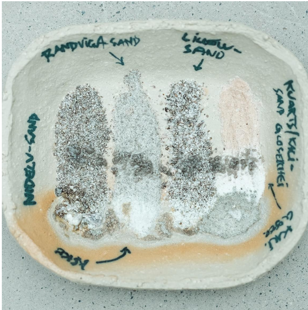
4 Prosessbilde: Testbrenning av forskjellige sand- og steintyper