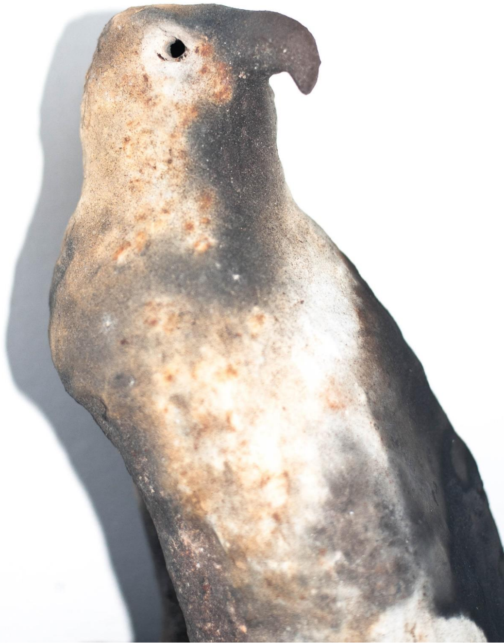
8 "uten tittel", 2021, muffelbrent steingods, 40x20x13 cm.