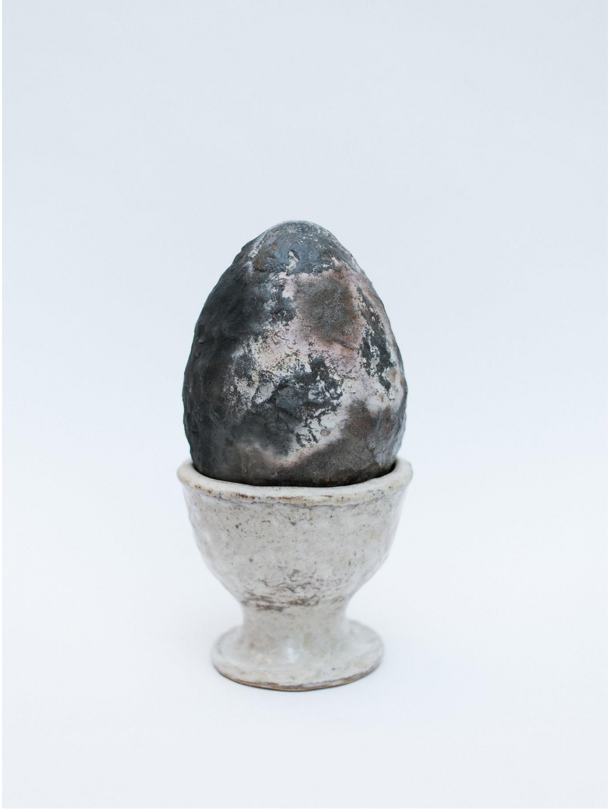
9 "uten tittel", 2022, muffelbrent steingods, glasur, 35x16 Ø cm.