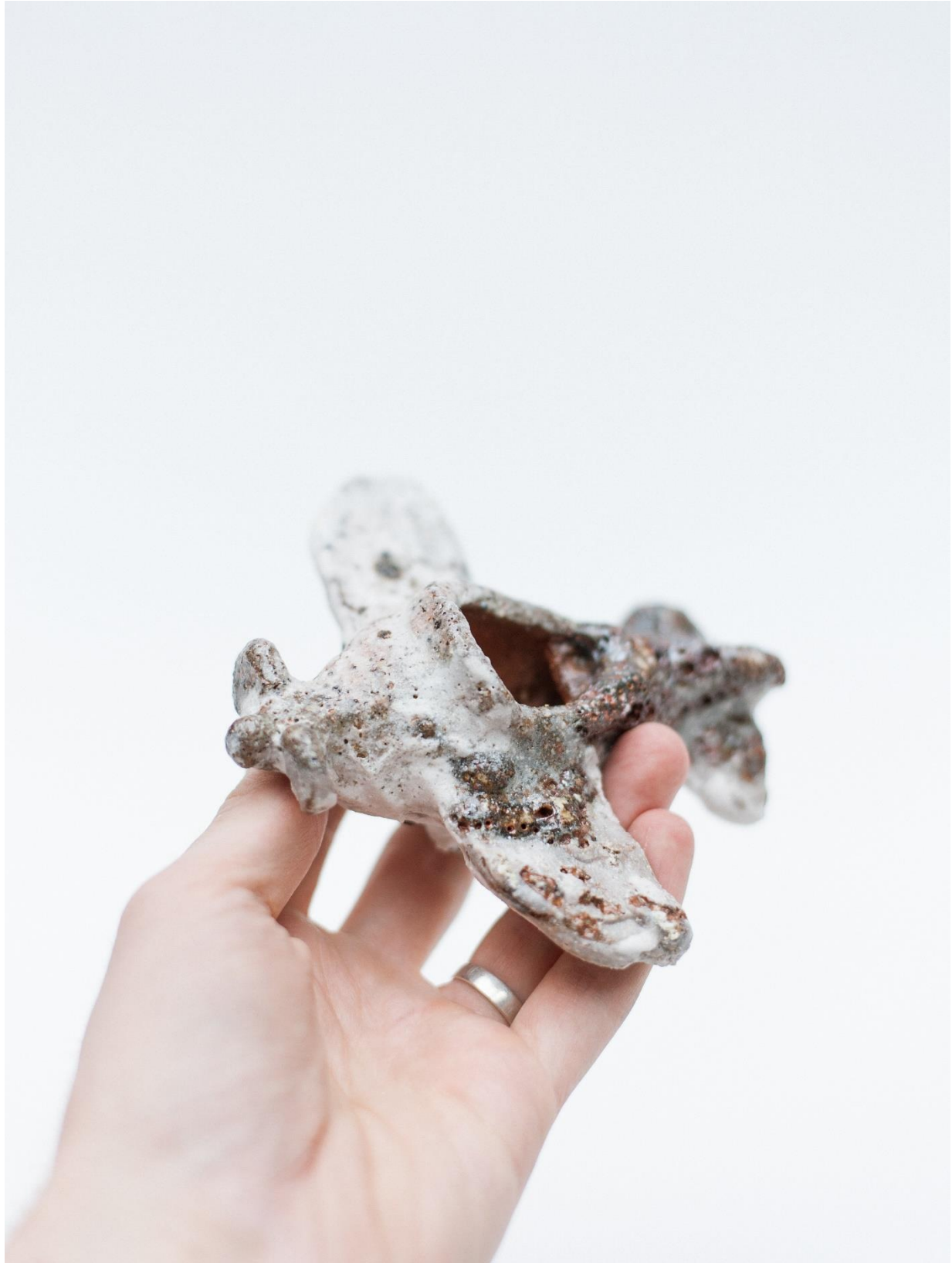
I "uten tittel", 2021, muffelbrent steingods, 12x12x6 cm.