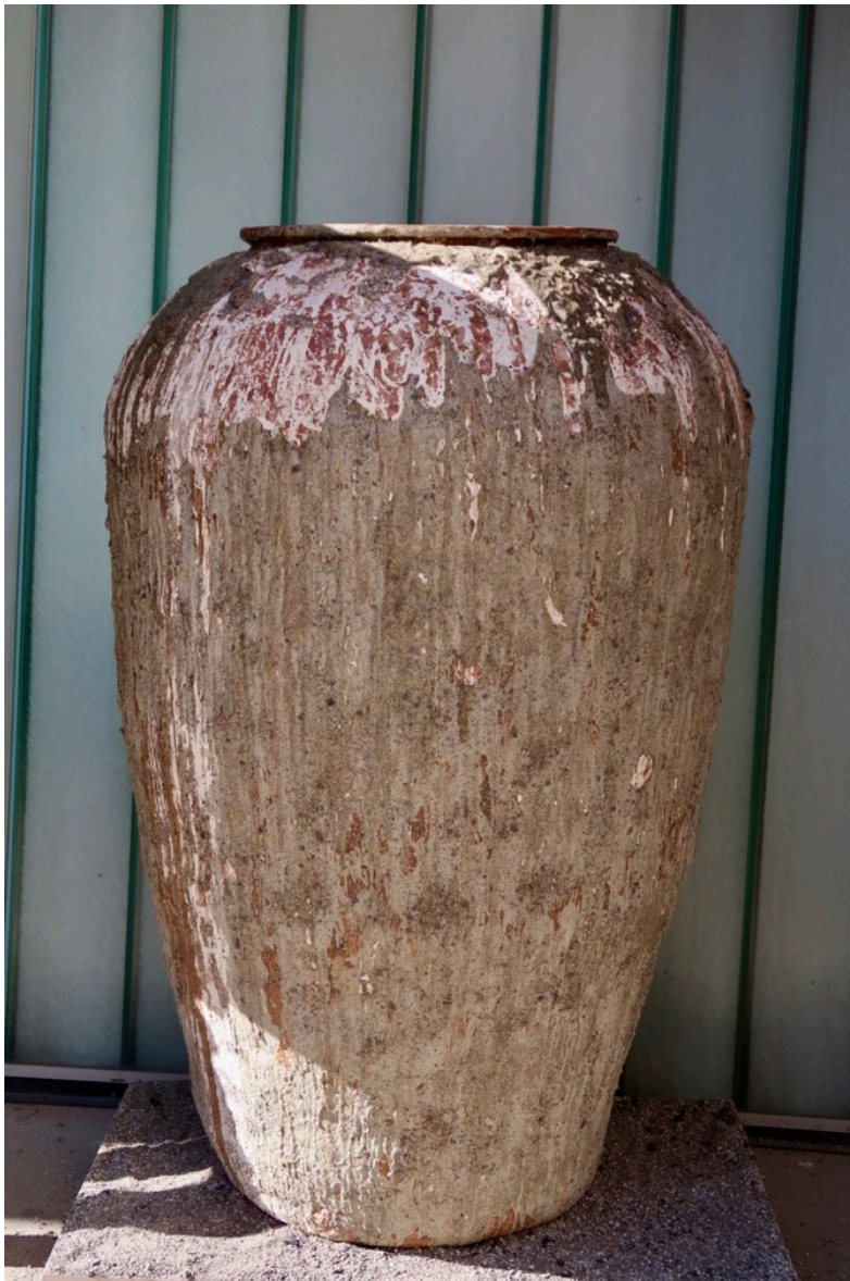
Fjorden.Steingodskrukke 1,70m høy, 0,7m bred med begitning & askeglasur.

Når «Fjorden» skal stilles ut kommer jeg til å spraye den med et uttrekk i fjordvann og alkohol av Japansk drivtang som er en av flere arter som er med på å skape ubalanse i Fjorden. Alkohol fordamper, men lukten av sjø og saltene vil sitte igjen på krukken. Når man er nære nok vil man lukte det. Jeg vil at beskueren også skal kunne ta på krukka, så de potensielt skal kunne lukte tangen på sine egne hender.