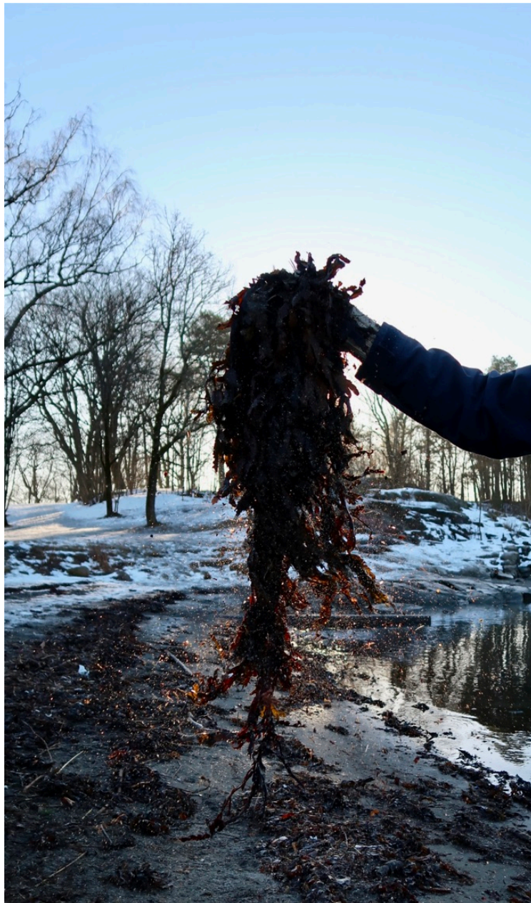
Tang som har blitt skylt på land av vær og vind, Huk.

Gjennom det grove uttrykket jeg har skapt forsøker jeg som tidligere nevnt å gi et inntrykk av at dette er noe som har ligget på sjøen i mange hundre år.