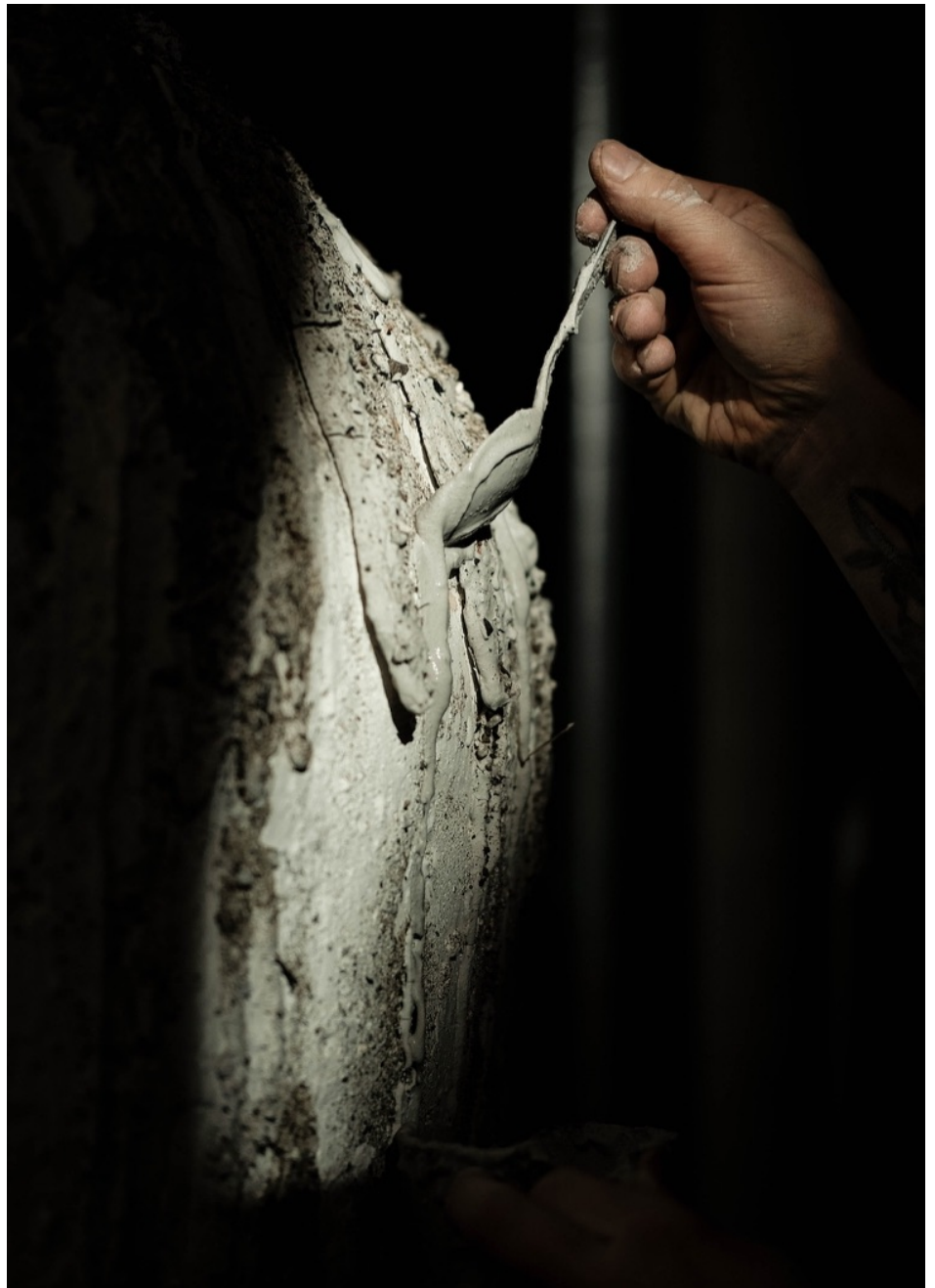
Påføring av østersskall begitning, foto: Audun Haga , 2022

Det krever tid og materialitetsforståelse å lage store former. Man må tenke stort fra tidlig i prosessen, det tar tid å bli trygg på pølseteknikk. Leiren krever tålmodighet for at den skal tåle den nye vekten som påføres. Samtidig skal man være effektivt nok til at man får en jevn tørking, slik at det store objektet ikke sprekker. Det krever også tid og kunnskap å utvikle egne glasurer som nesten utelukkende er produsert av råstoff man har hentet og foredlet selv. For meg ligger den største verdien av denne krukka i mine hender og erfaring. Jeg har siden jeg begynte på Kunsthøgskolen i Oslo hatt et ønske om å