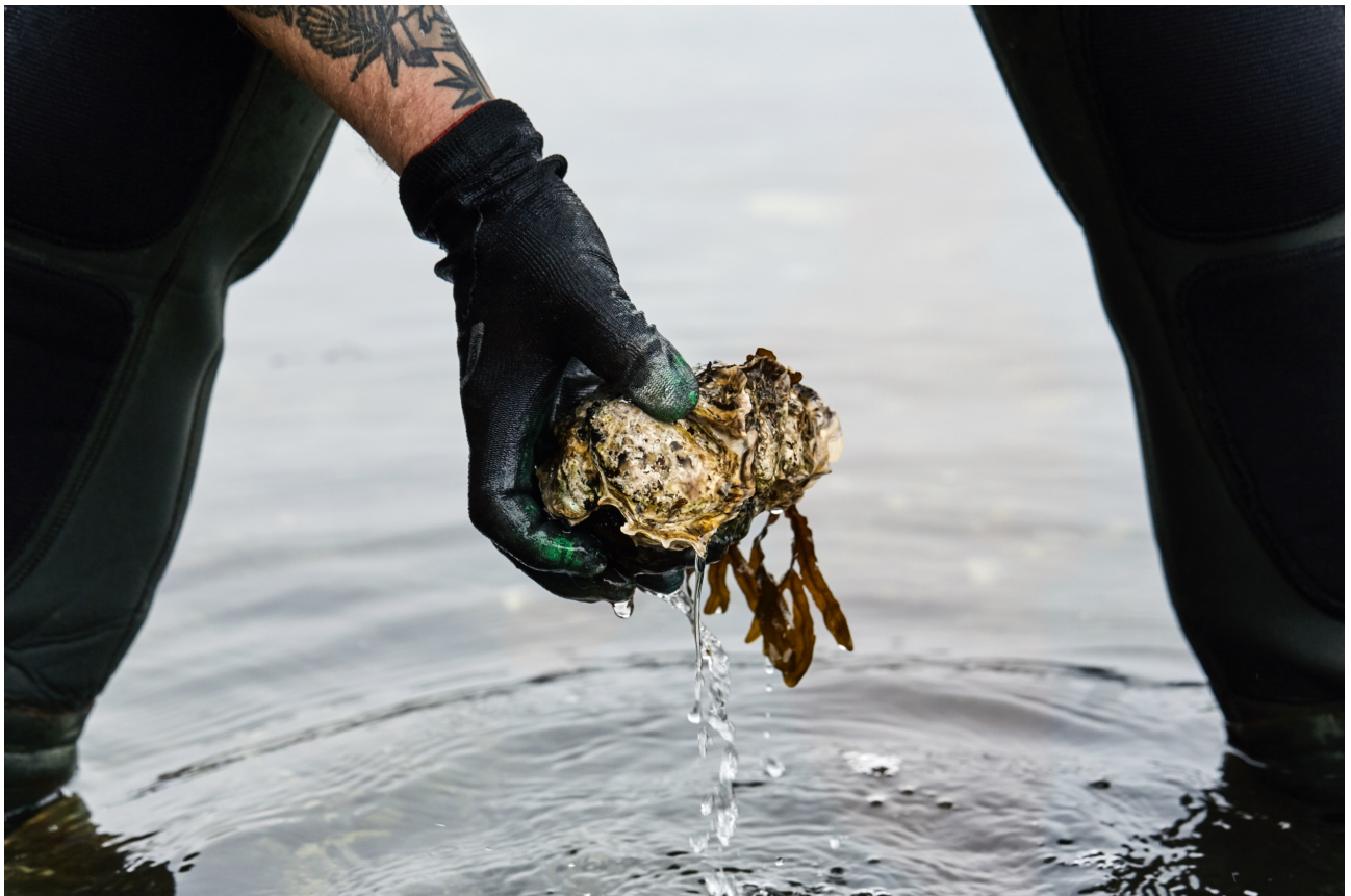
Stillehavsøsters plukket på Håøya.

Biomassen den skaper i løpet av sesongen synker til slutt ned og legger seg som et teppe over havbunnen og er med på å skape et oksygenfattig miljø for livet der nede (Rueness, 2021).