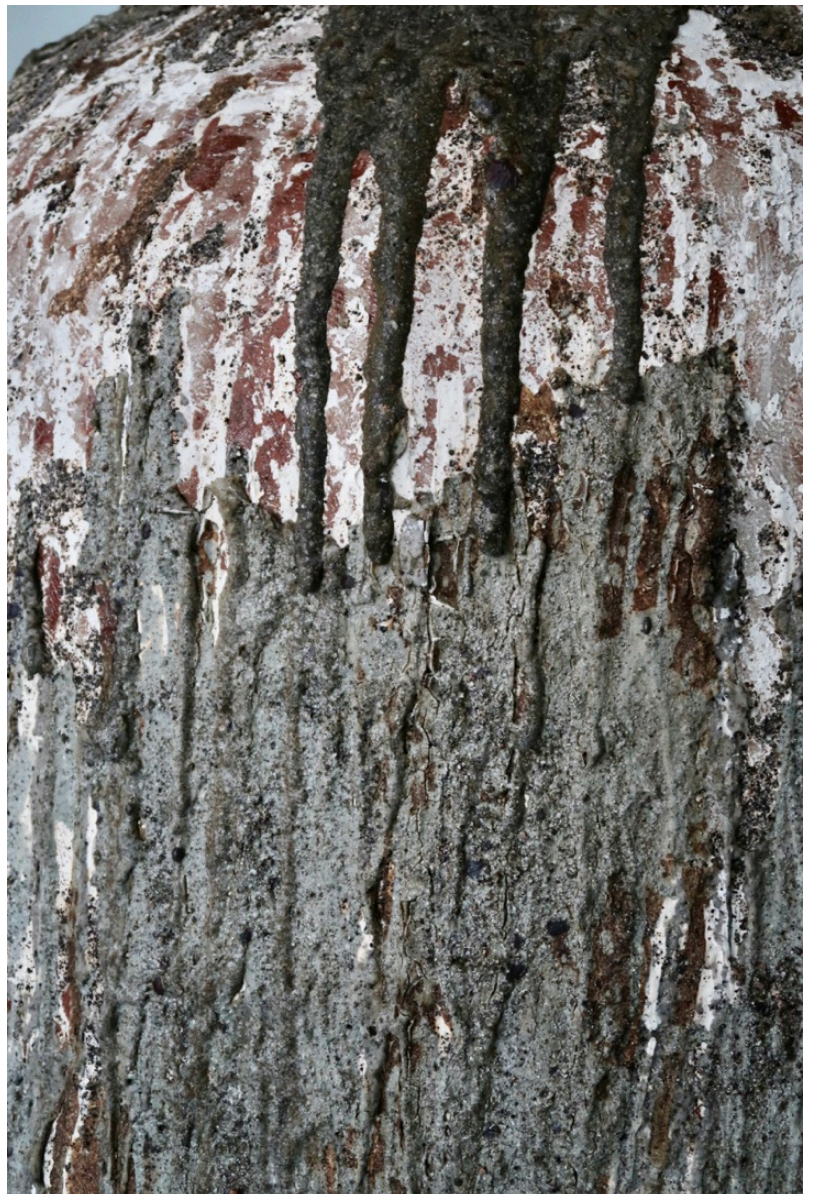
Fjorden (detalj) som viser askeglasuroverflate.

jern, og dette blør ut i strukturen på grunn av dens lave smeltepunkt. Samtidig skaper sanden