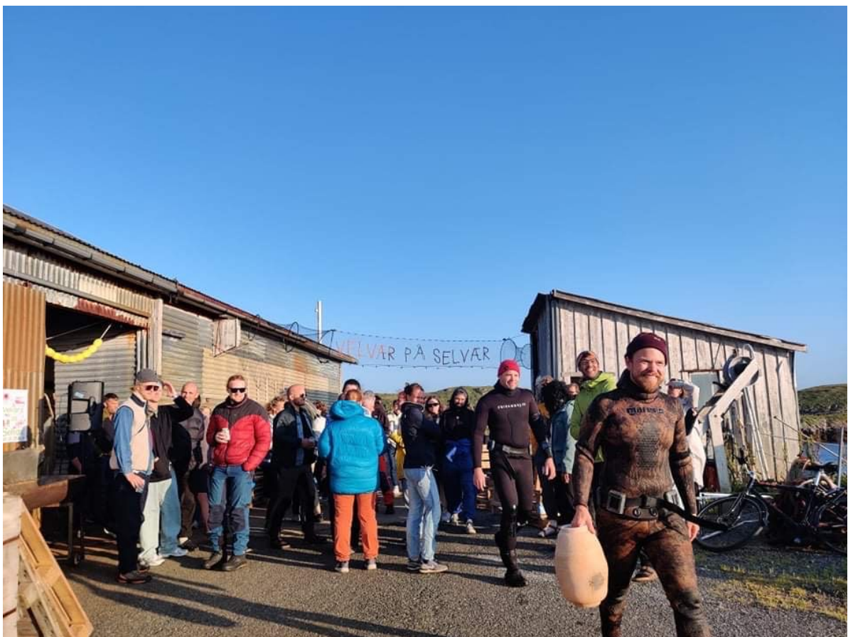
Engasjere og formidle, bilde fra da jeg var festivalkunstner under Velvær på Selvær. Foto: Mathias Tjønn, 2021