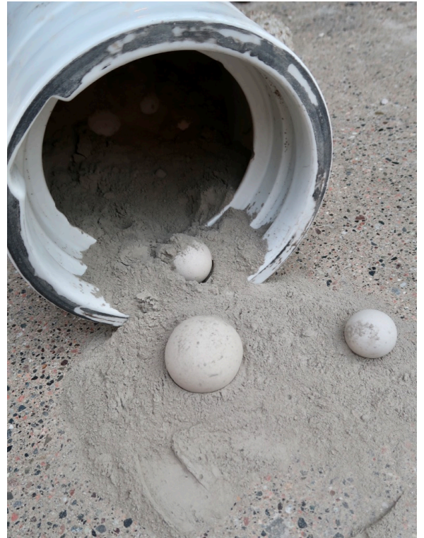
Prosess, Ballmill, knusing av Blåleire til fint pulver. Foto: Halvor Digernes, 2022