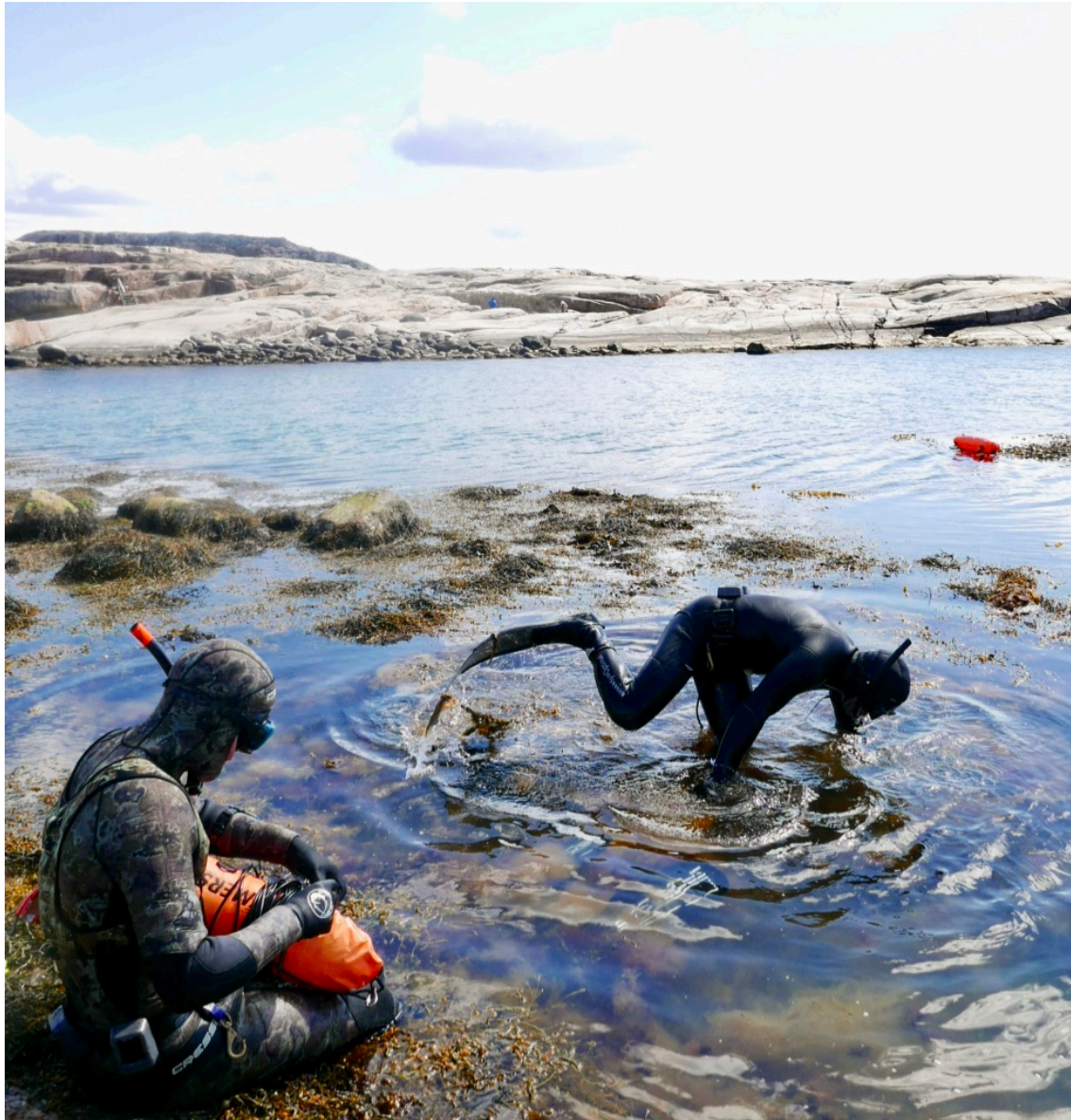
Sanking av tang og østers, Hvaler.

Jeg har holdt på med dykking og fridykking i en ti års tid og har sett det oftere og oftere. Når du bryter ned under vannskorpa så er det mer eller mindre dødt. Et ørkenlandskap av skjeletter etter skjell, rester fra tareskoger, grumsete grønt algevann. Noe som en gang virket så klart og friskt virker til tider uoversiktlig og ukjent. Man kjenner umiddelbart at det er noen som er i ubalanse, at det er noe som er feil.