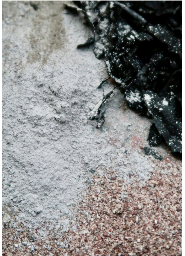
Materialene som bestemte uttrykket på glasuren til «Fjorden». Blåleire, østerskall knust til fint pulver, tang og sand

Jeg vil vekke engasjement og interesse ved å skape objekter som kobles til verden vi lever i.