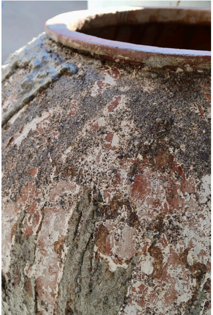
Fjorden (detalj) krukke laget i steingods med askeglasur og begitning. Foto: Halvor Skiftun Digernes, 2022

Vi lever i en tid hvor natur og menneske kjemper mot hverandre, det ligger i menneskets natur å utnytte de ressursene vi har. Oslofjorden er et eksempel på dette. Fjorden var på et tidspunkt en av de mest levende og fiskerike fjordene vi hadde her i Norge. Nå er det skjøre økosystemet i ubalanse på grunn av menneskelig påvirkning.