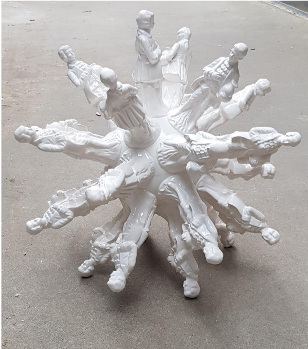
The Virus On my Mind, porslin, 46x50x50 cm, 2022

Avsaknad av färg, vit, bara formen som får prata. Jag hade en misstanke om att det kanske skulle påminna lite om coronaviruset, men det väl inte så mycket till nu när vi levtt i en pandemi de senaste två åren. Det blev extra påtagligt för mig när den hade kommit ut ur ugnen och jag bar upp den till skrivbordet. Där stod den stor, vit och spretande åt alla håll omgiven av allt det som är min vardag.