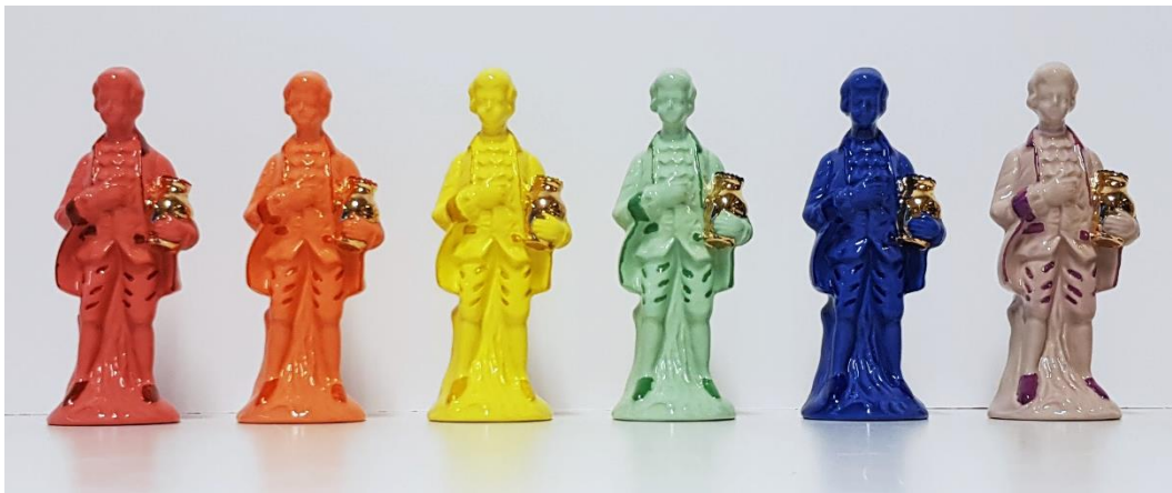
Pots Of Gold, Färgat porslin, porslinsfärg, guldluster och rhinestones, 17x6x6 cm, 2021

Pots of Gold, är ett verk som jag gjort inspirerat av tanken på att det ska vara en kruka med guld vid slutet av regnbågen. Men jag tänkte på det från ett queert perspektiv, och tror då inte att det bara är en kruka med guld utan flera. Symboliken blir för mig att även om vi alla är olika så är vi lika på samma gång och att det är det som för oss samman.