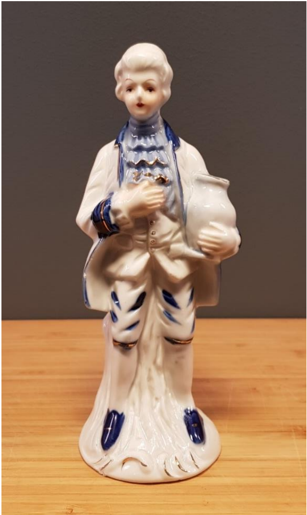
"Original figurinen", innan han tappade huvudet.