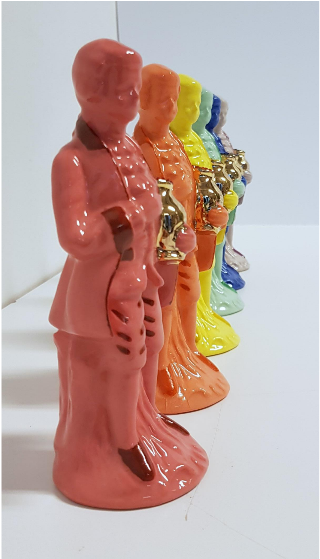
Pots Of Gold, Färgat porslin, porslinsfärg, guldcluster och rhinestones, 17x6x6 cm, 2021