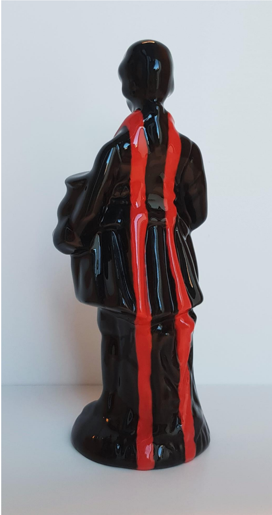
Fisting, Infärgatporslin, 17x6x6 cm, 2022