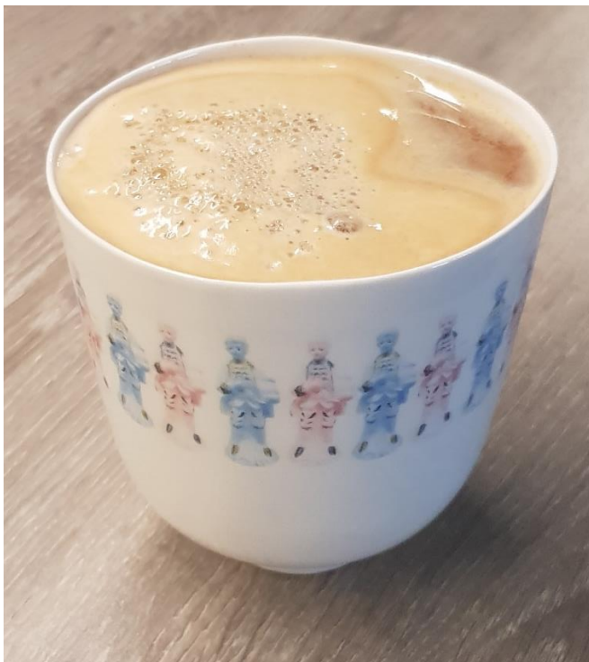
Kopp med dekaler av figurinen, Porslin 8,5x8x8 cm, 2021

När jag sedan ska gjuta figuriner i flytande gjutporslin så kan jag gå tillbaka till färgtesterna och färga in en liten mängd gjutporslin i en färg som passar till det jag vill göra med figurinen när jag vill ha något annat än vit. Sedan håller jag gjutmassan i gipsformen, väntar tills det bildats ett lager porslin inne i formen håller ut det överflödiga gjutporslinet och väntar tills det har stelnat lite innan jag tar den nya figurinen ut ur gipsformen och repeterar processen.