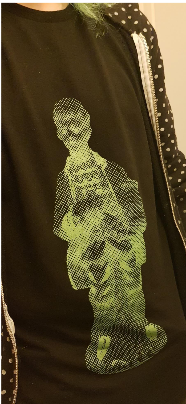
Silketryck på t-shirt, ca 42cm, 2021