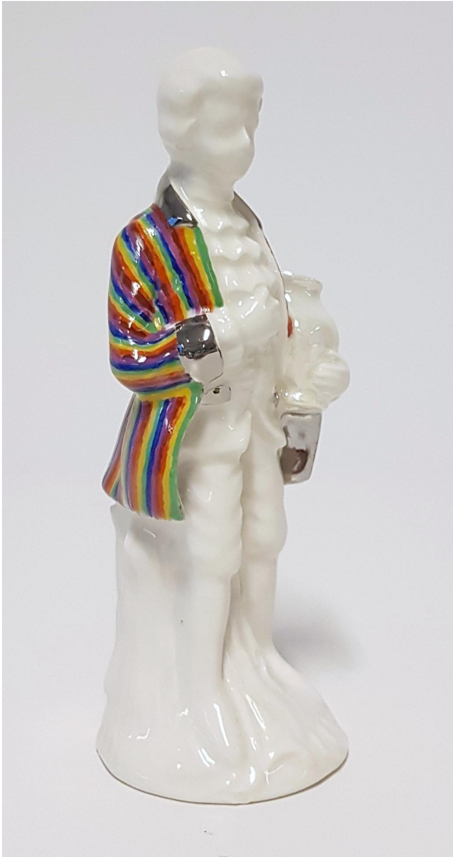
Ready for Pride, Porcelain, Porcelain color and Luster 17x6x6 cm, 2021