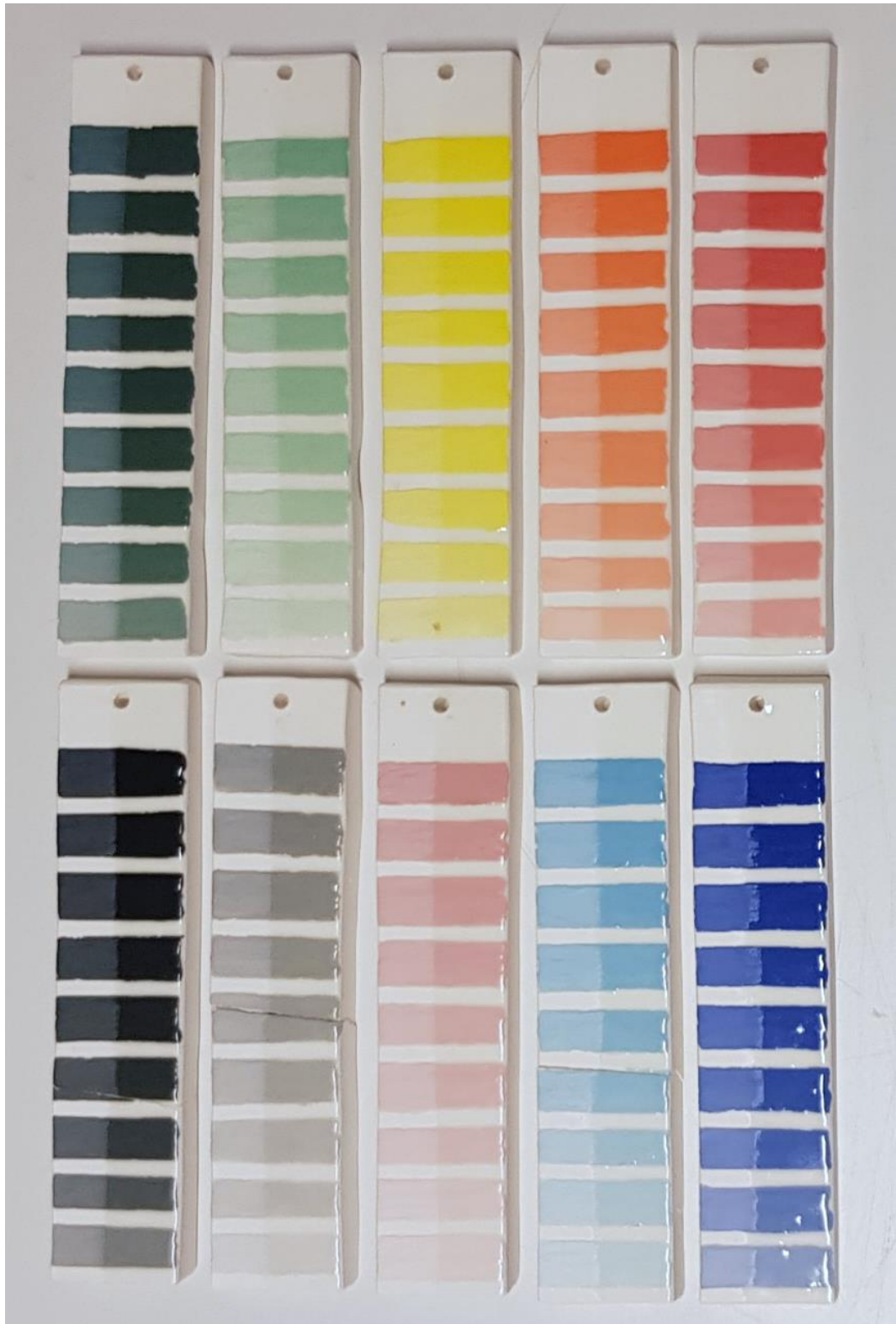
Olika färgtester på porslin, ca 3x14,5 cm.