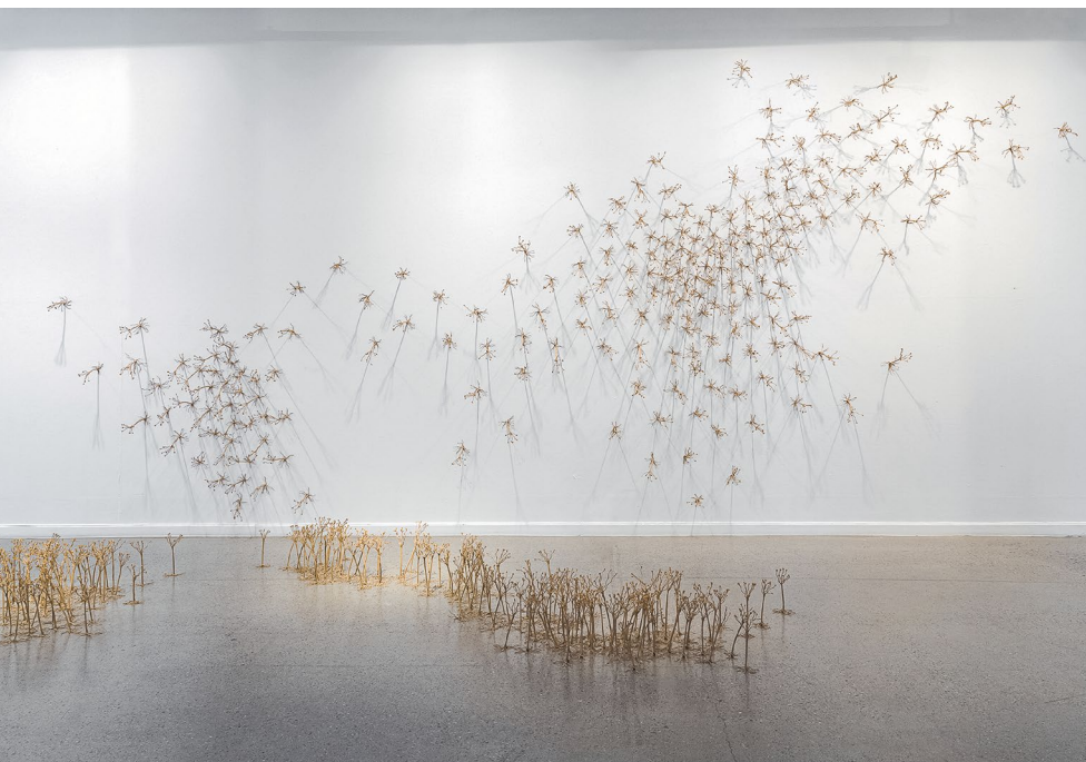
Rooted 2, paper thread ↓