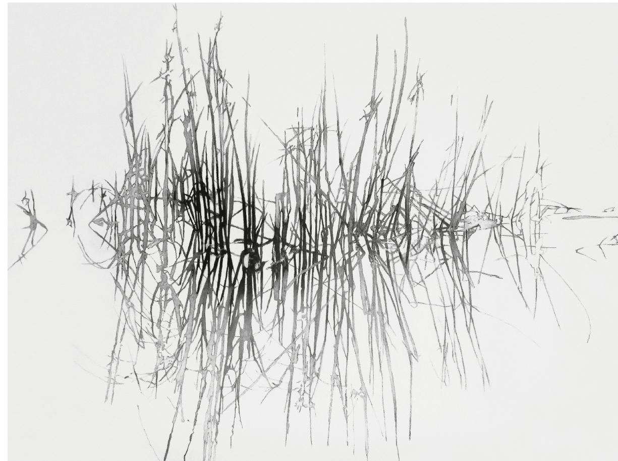
↓ Silence, 2017. 100 × 140 cm, pencil drawing