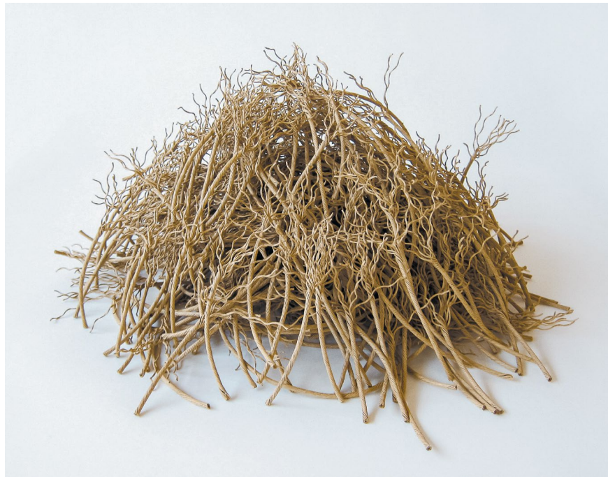
Gathering 3, paper thread