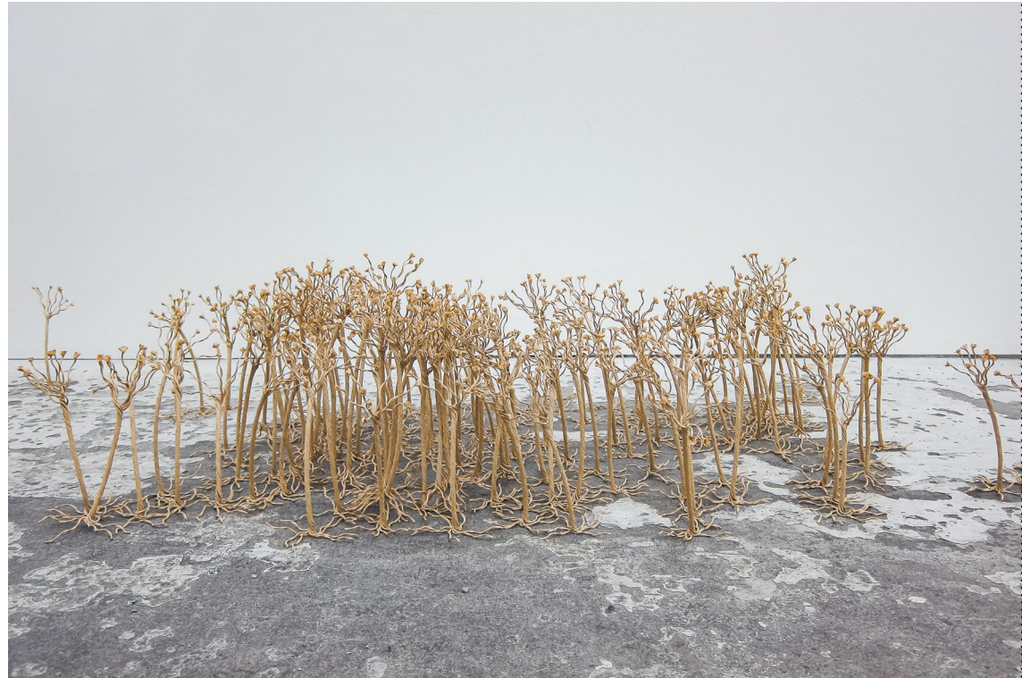
Rooted, installation, detail, Barum Kunsthall