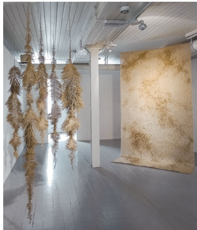
Growing, Seeded, 2018. House of Foundation