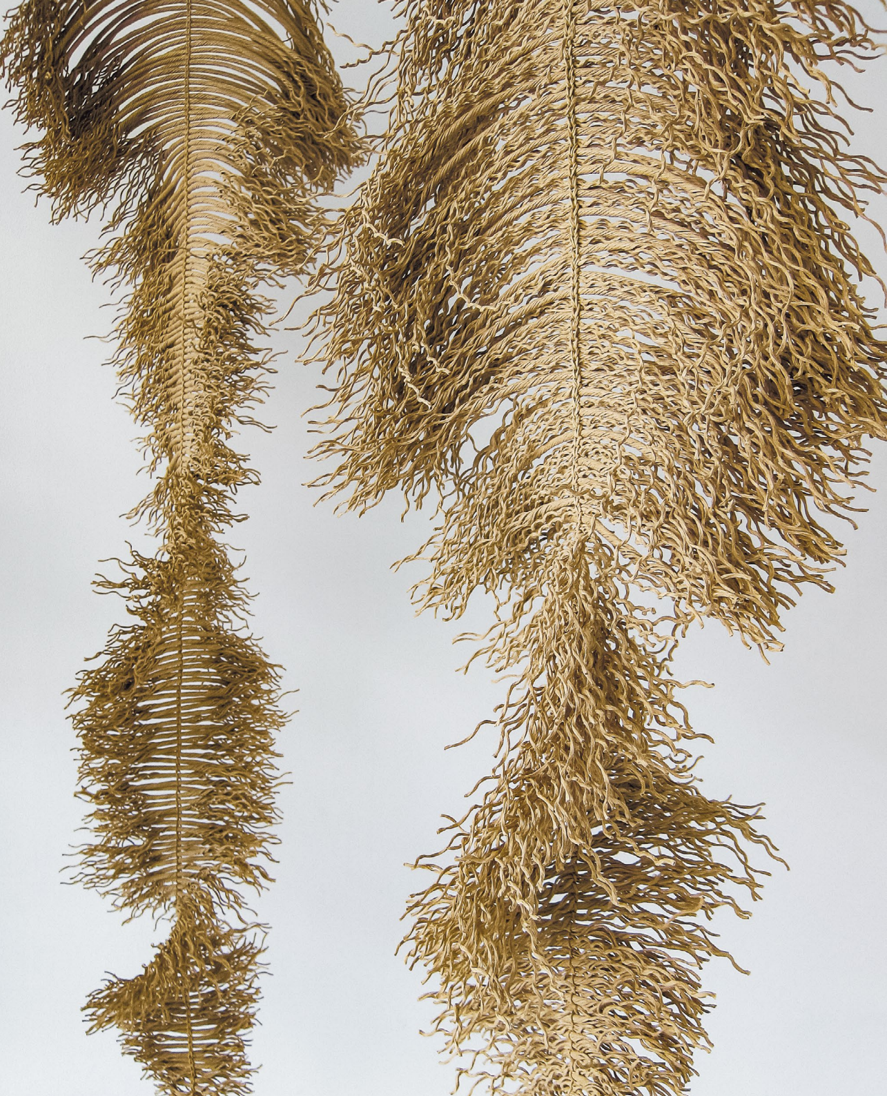
← Growing, installation, detail 2, paper thread