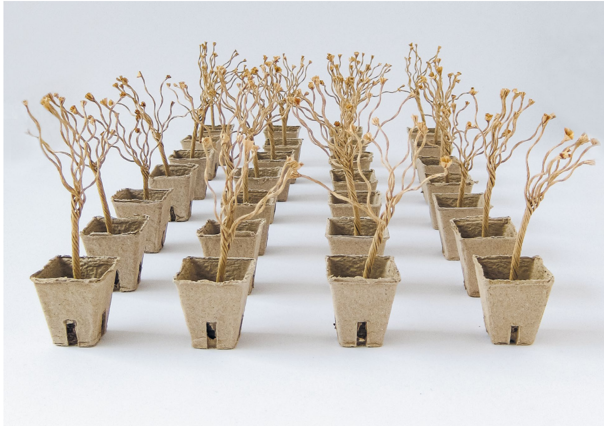
Similar, yet unique, paper thread and cardboard pots