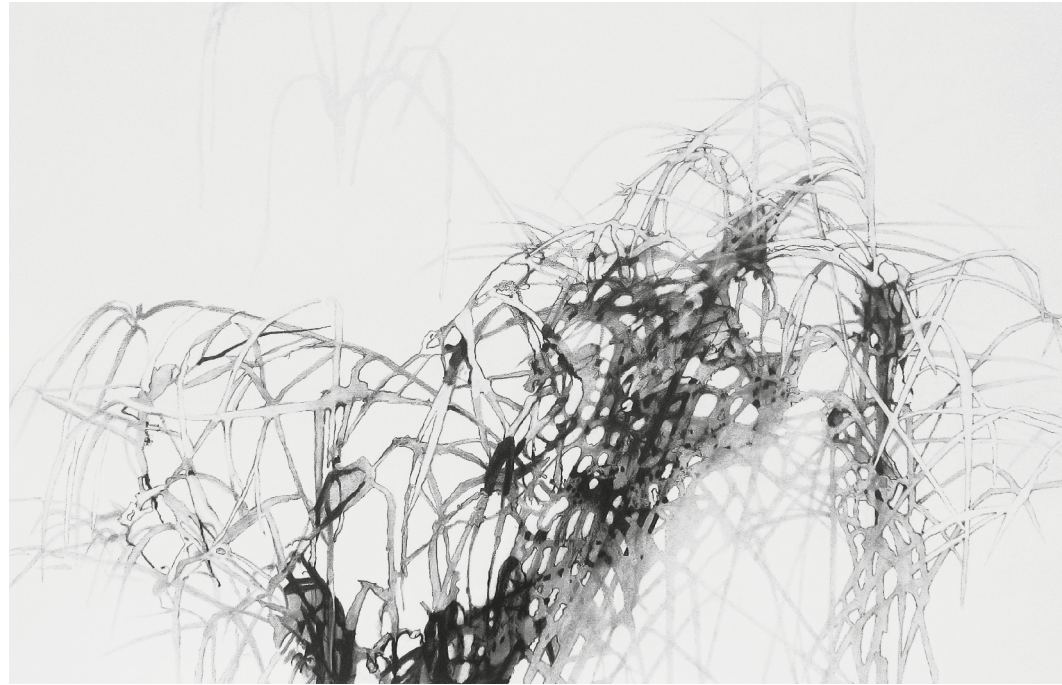
Intricate, but simple I, 2013. 75 × 105 cm, pencil drawing