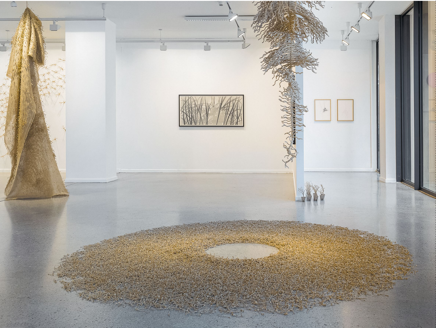
from the exhibition at Buskerud Kunstsenter