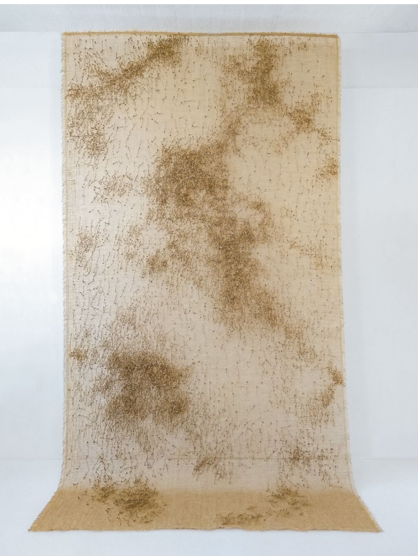
Seeded, 2018. Paper thread, jute