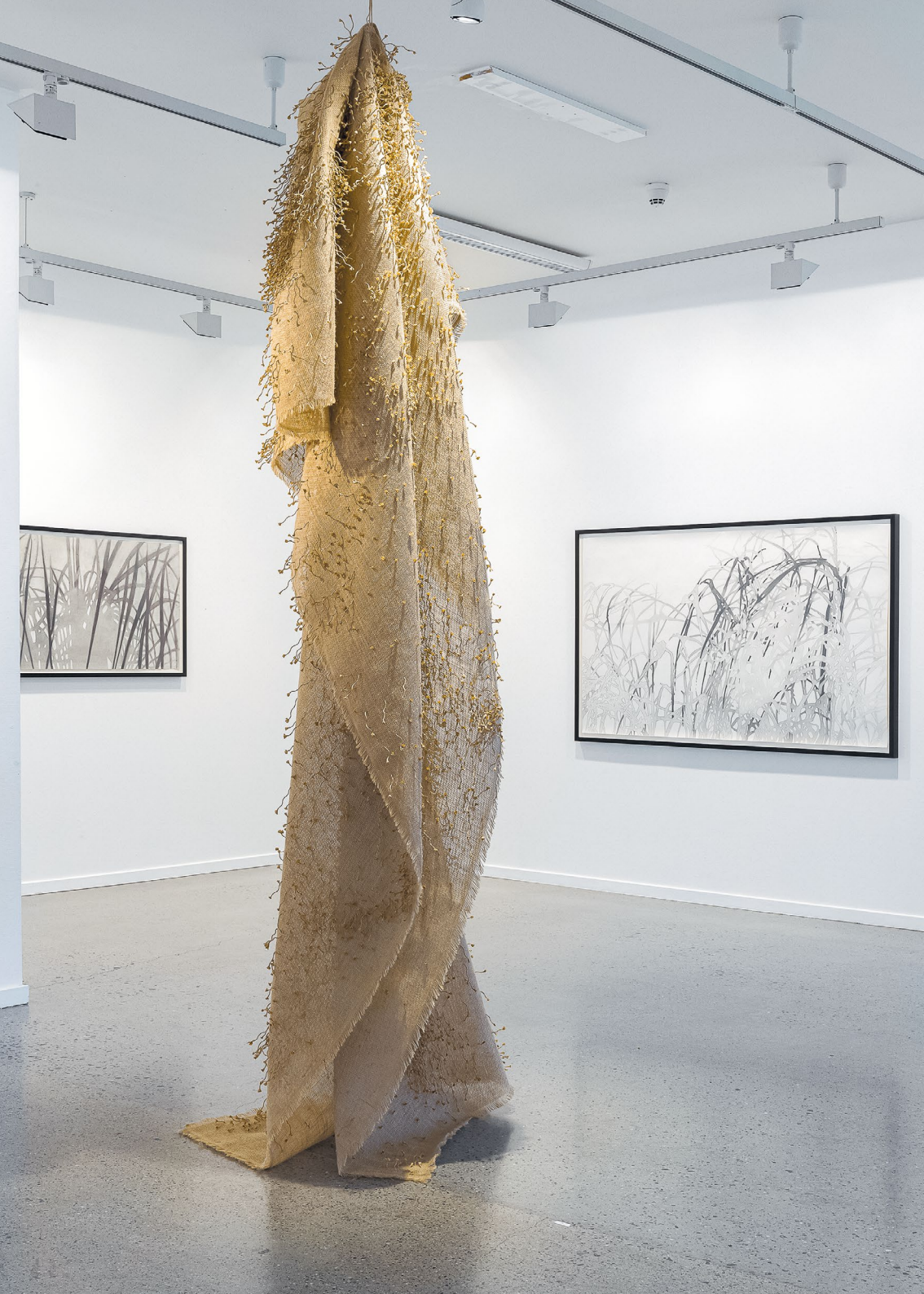
← Seeded II, 2019. paper thread, jute, Buskerud Kunstsenter