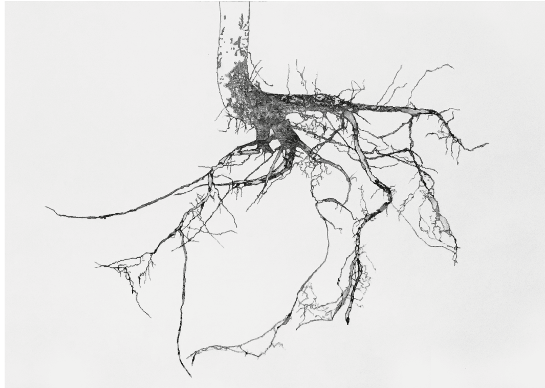
Growth VIII, 2019. 76 × 106 cm, pencil drawing