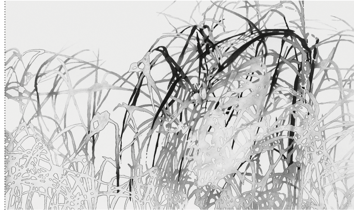
Intricate, but simple II, 2015. 95 × 154 cm, pencil drawing