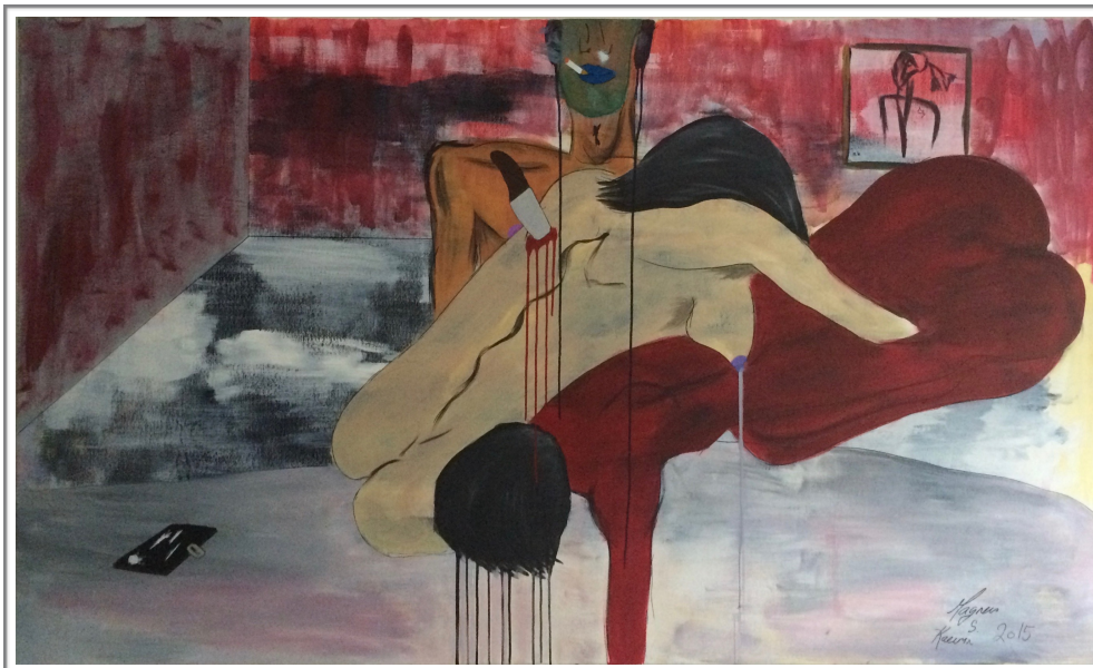
«Crime passionnel», 2015

utfordrende prosess for meg som maler, fordi lukketiden, altså herdningsperioden i oljemaleriet, er mye lenger enn i akrylmaleriet.