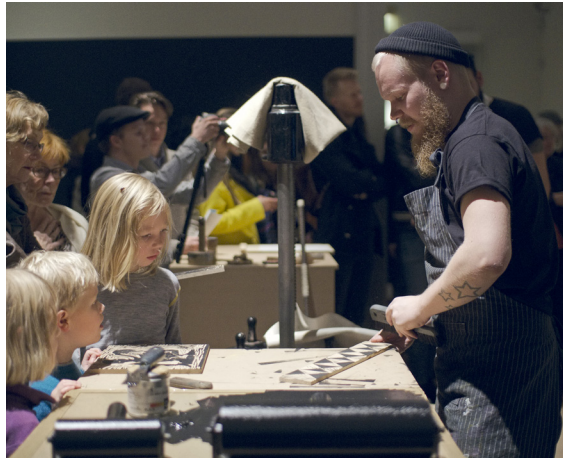
Krause Kollektivet på National Galleriet i Oslo.