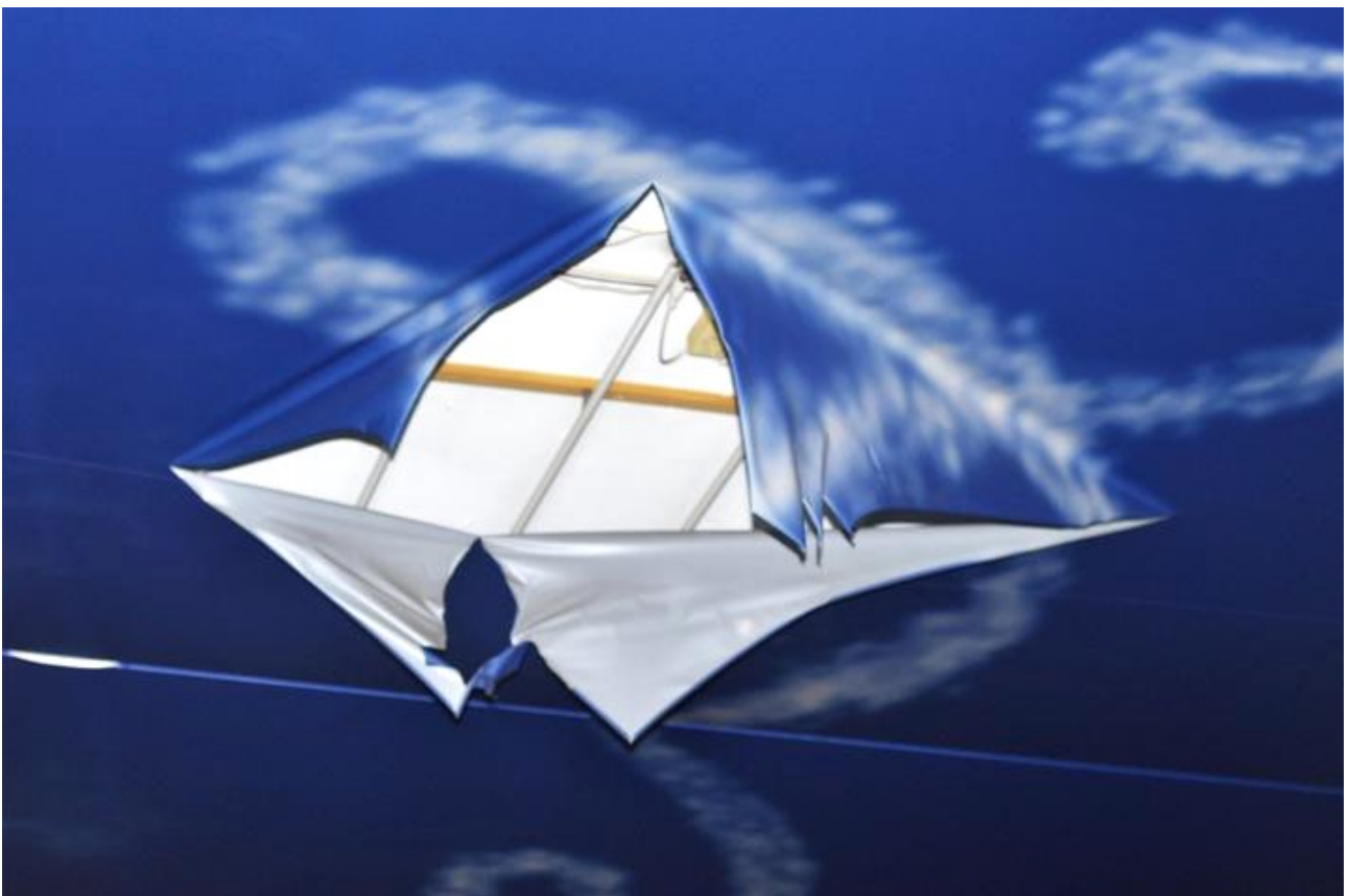
Rupture (Omonia), 2011

Denna spårning medför givetvis grundläggande frågeställningar om innebörden av att vara konstnär, speciellt i relation till sammanslagningen av vardagen och konstnärlig praxis, eller kapaciteten till konstnärlig produktion om så vill. Upplevelsen av intersubjektiviteten sträcker sig idag via informationsflödet också bortom bara kroppar och inkluderar även de bakomliggande strukturerna och finansiella nätverken som möjliggör våra sammanhang från första början, och avslöjar därigenom även i stor grad konsekvenserna av agerandet innanför sammanhangen vilket sedan beroende på vilken person man väljer att vara, låter sig påverkas. När jag sedan blandar denna tankegång med ett utilitaristisk rättviseperspektiv och klasstillhörighet à la skandinavisk socialdemokrati skapas givetvis kollisioner i mitt eget arbete, konstverk kommer därför i vågor mellan mina interna slag om meningsfullhet och är ofta svårbegripliga för mig själv om var, när och hur de börjar och slutar, de är snarare likt detta resonemang, konceptuella tankespår relaterade till ett specifikt ramverk eller plats.