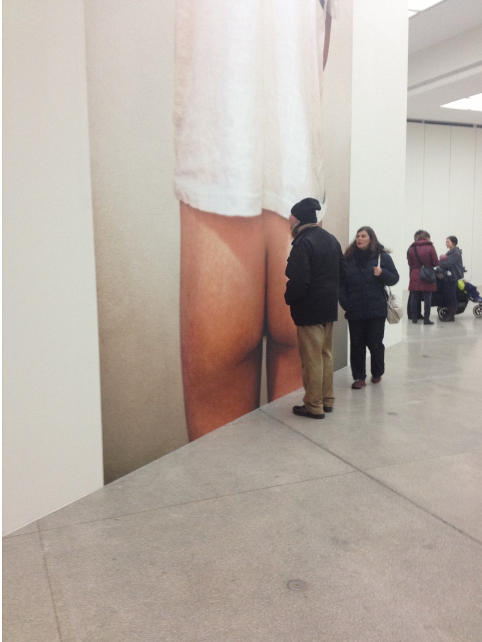
Sarah Lucas, Complete Arsehole , Secession, Wien, 2013