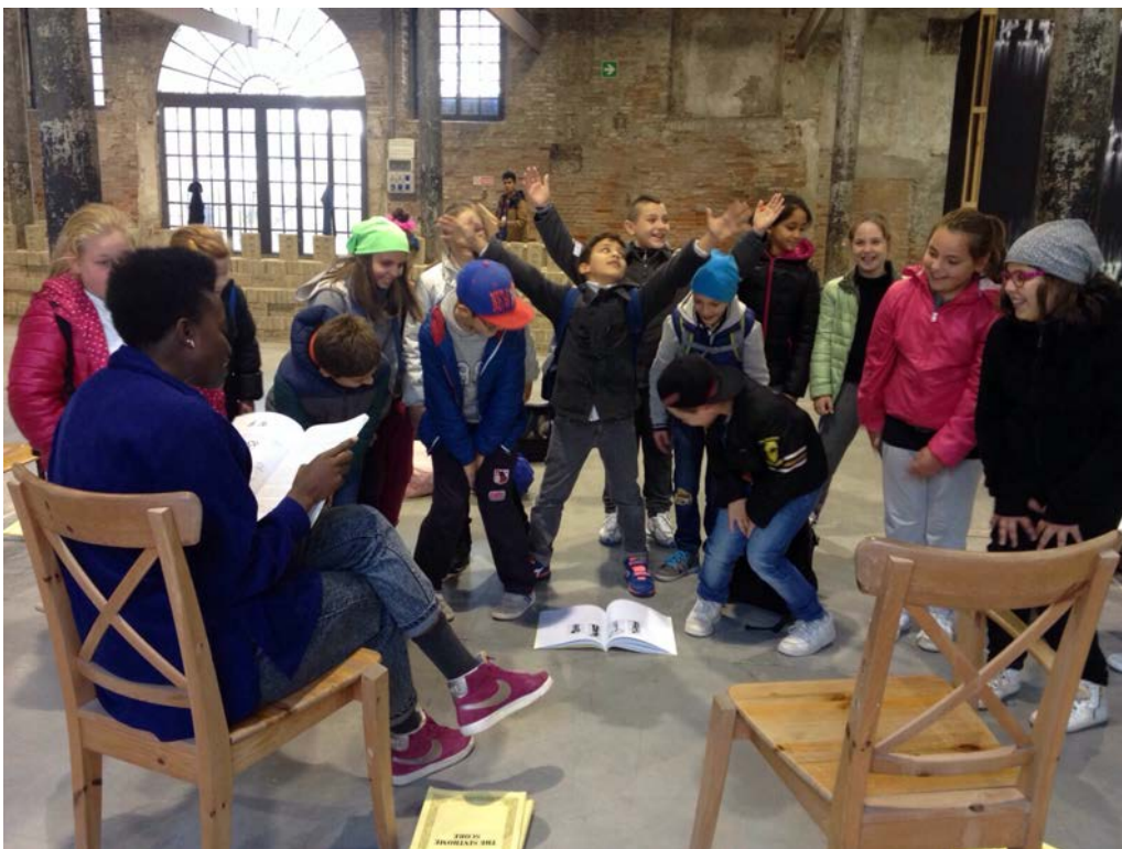
22 de octubre, un grupo de performers muy jóvenes