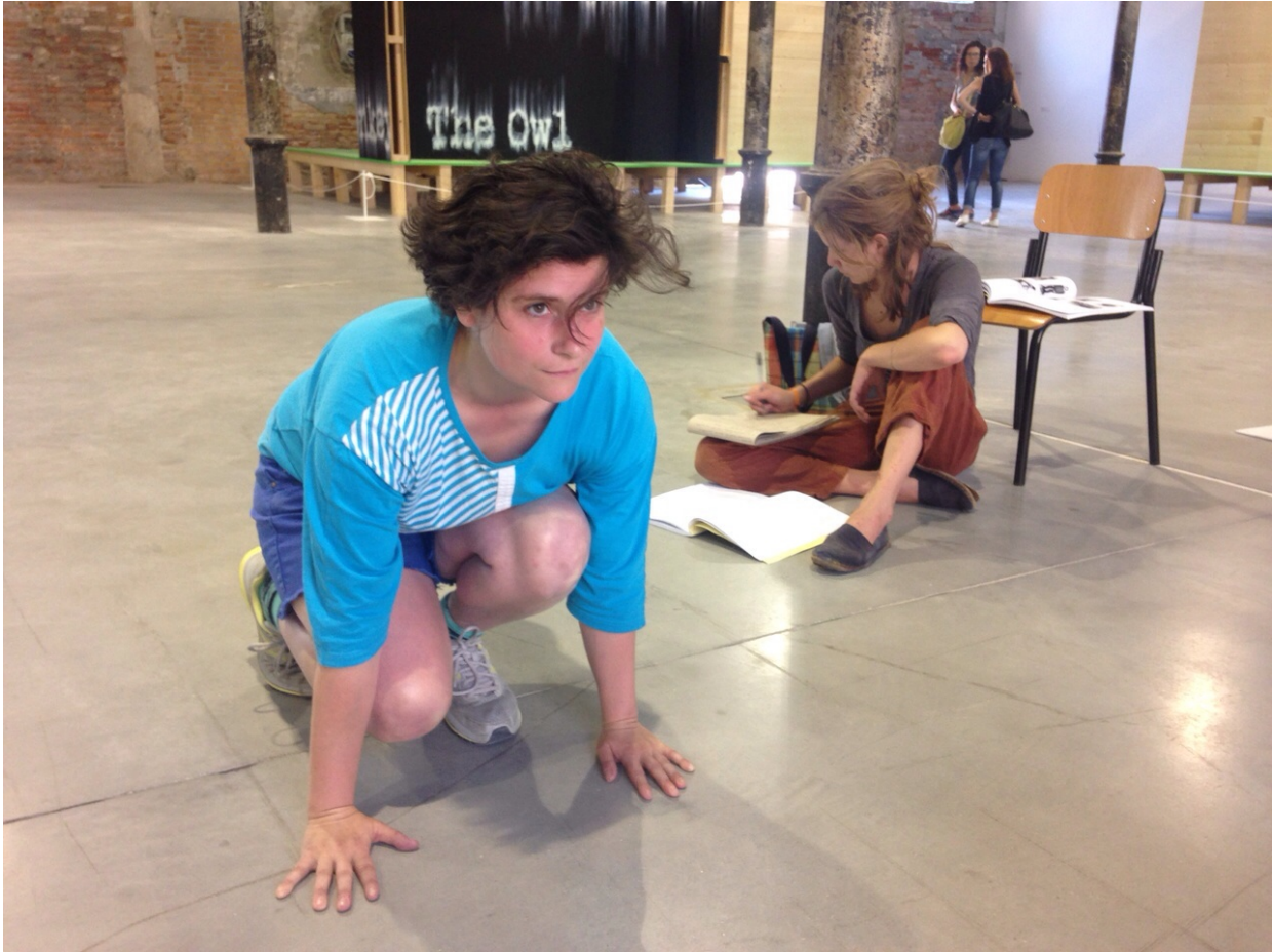
21 de junio